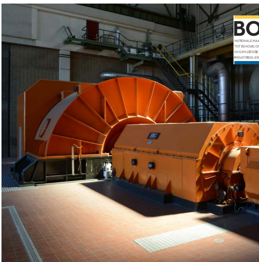
Geertruidenberg, Dongecentrale waarin een generator gemaakt door Brown Boveri & Co. (BBC), nu eigen- dom BOEi.