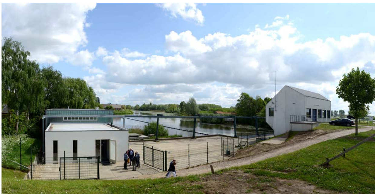
Appeltorn, links op de foto het Motoren museum waarin vele stationaire motoren van rond 1900 staan. Dit is een extra activiteit bij stoomgemaal De Tuut (links buiten beeld). Rechts het elektrisch gemaal dat de Tuut verving. Foto 8 mei 2014.

Door de jaren heen is FIEN gebleven wat de oprichters voor ogen stond; een landelijk platform voor de uitwisseling van kennis en ervaring, contact en samenwerking. Met daarnaast een bescheiden positie als landelijk aanspreekpunt voor de toenmalige Rijksdienst voor de Monumentenzorg (RDMZ) van het Ministerie van OCW. Deze positie is door RDMZ lang gewaardeerd met een jaarlijkse subsidie. Samen met de bescheiden bijdragen van de AO's kon FIEN - zelf ook een vrijwilligersorganisatie - haar bestuur en activiteiten voor de achterban bekostigen.