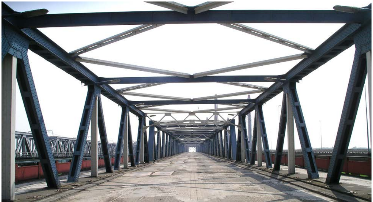
Zaltbommel, de brug die Martinus Nijhof bezong in zijn gedicht met als beginregel: "Ik ging naar Bommel om de brug te zien". Inmiddels is deze oude verkeersbrug over de Waal, die ooit een herbestemming zou vinden in Suriname, gesloopt. Foto 13 mei 2006