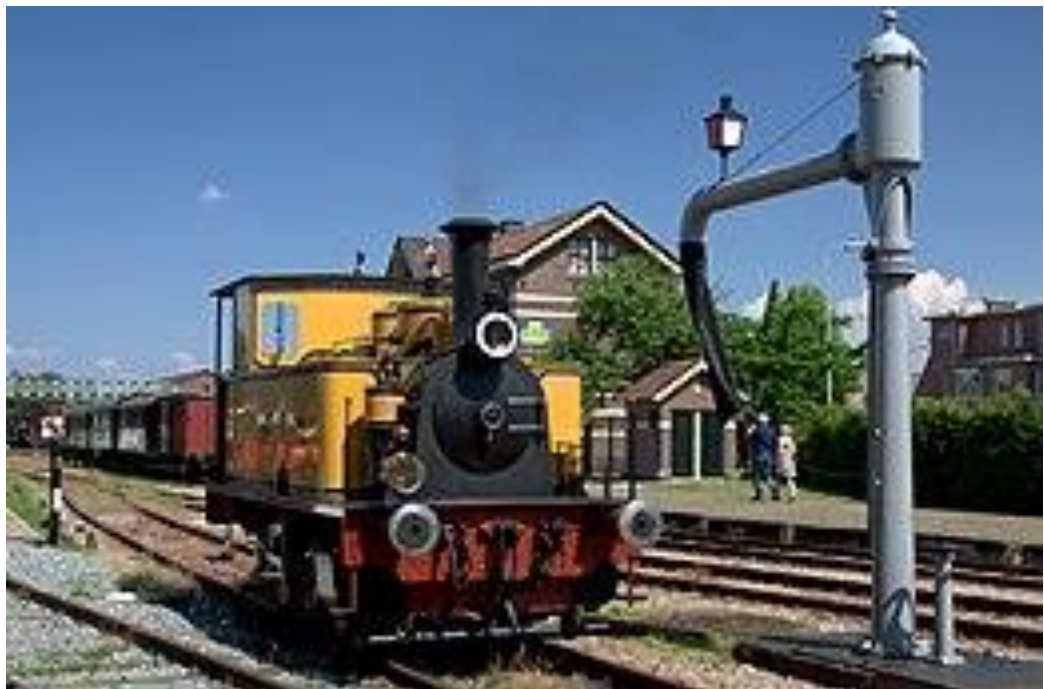
Locomotief 6 'Magda' bij de waterkolom in Haaksbergen; 2016.

Met de trein naar Hengelo. Neem de noordelijke uitgang. Dan lopen naar bushalte ;Centraal station perron D1. Neem RRReis Bus 53. Vertrektijden zijn ; 9:19 / 9:49 /10:19 /10:49. Aankomst in Haaksbergen en uitstappen op Bushalte Mr. Eenhuisstraat. Aankomsttijden zijn: 9.43 /10.13/10.43/11.13. Vervolgens is het 5 minuten lopen naar de MBS aan de Stationsstraat 3.