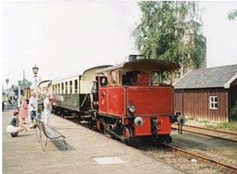
Cockerill-loc 2, met staande ketel, nog in de eerdere rode uitvoering 1998