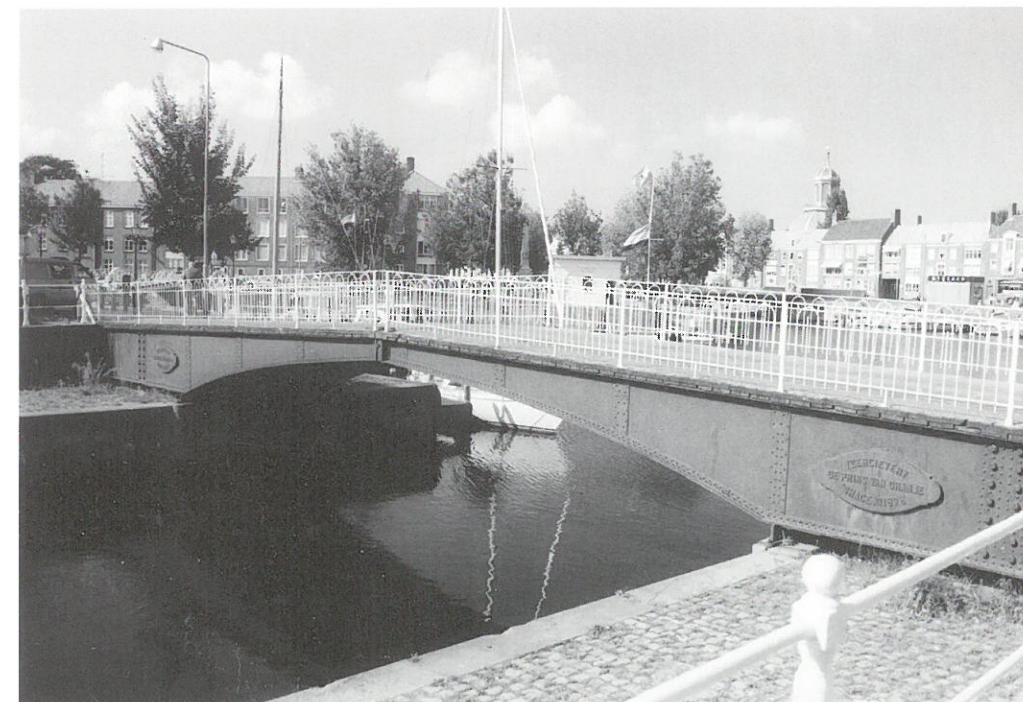
Middelburg: Dokbrug

Middelburg • In het oude stadscentrum van Middelburg zijn nog diverse historische gietijzeren bruggen te vinden. Een van deze bruggen, de Dokbrug over het Balkengat werd in 1877 gebouwd als gietijzeren draaibrug door de ijzergieterij De Prins Van Oranje in Den Haag.