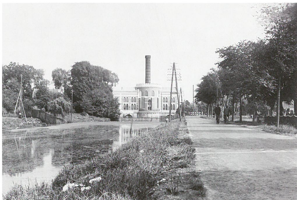
Polderlandschap Haarlemmermeer (prentbriefkaart ca. 1925)