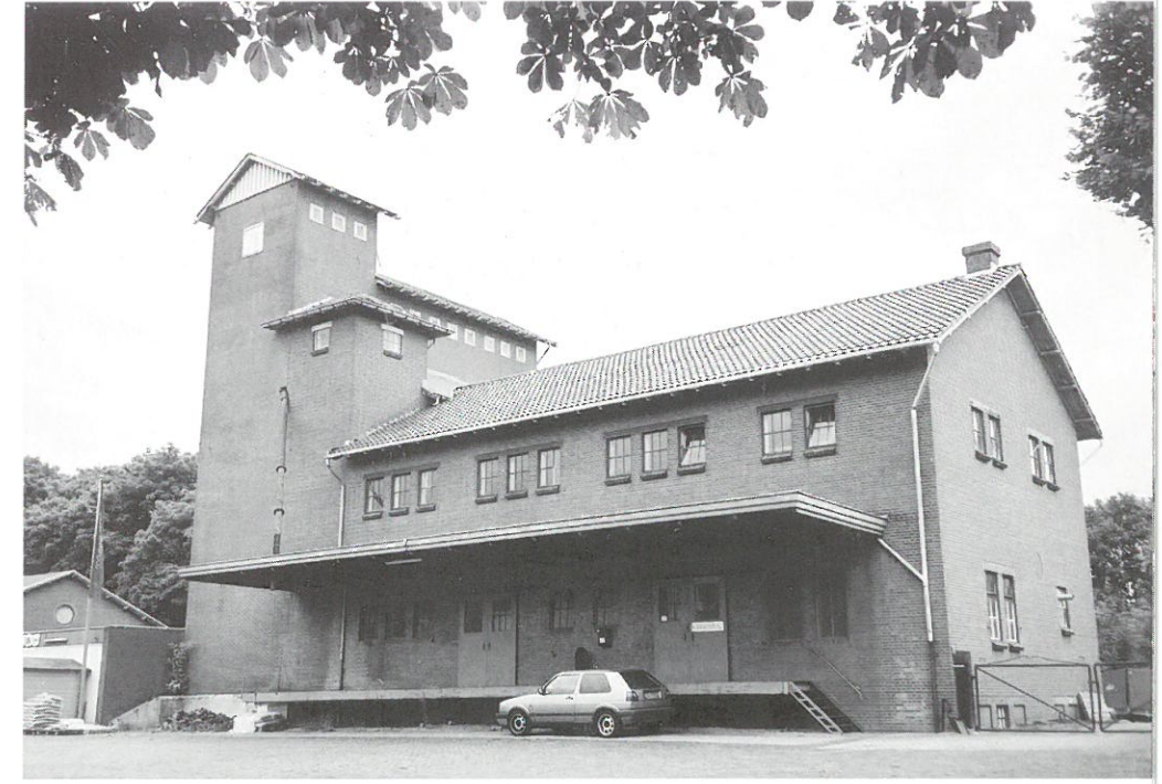
Epe: silocomplex landbouwcoöperatie

Een waardevol element dat herinnert aan de geschiedenis van de Vredestein fabriek is een monumentaal tegeltableau, dat afkomstig is van de oude fabriek in Heveadorp, en in 1979 werd overgebracht naar de nieuwe fabriek in