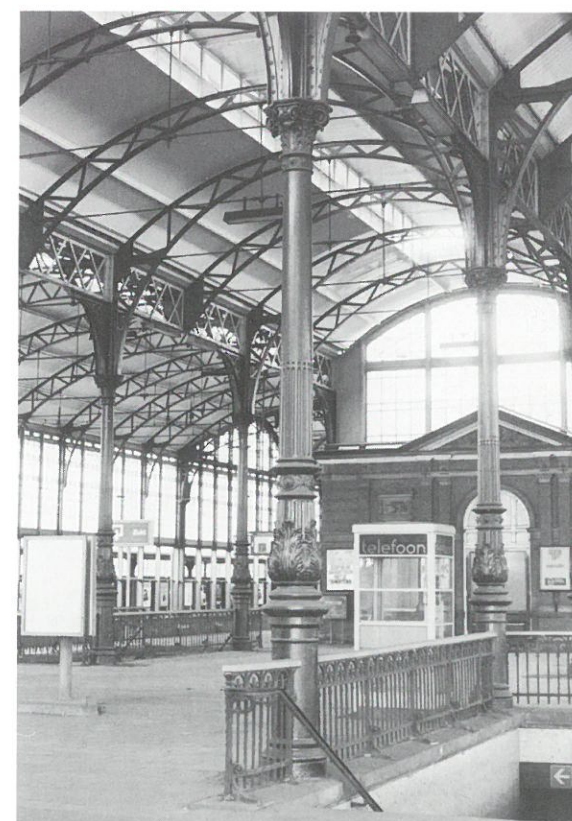
Den Haag: gietijzeren overkapping station Hollands Spoor

Franeker • De gemeente Franeker heeft een sloopvergunning verleend voor de bedrijfsgebouwen van de voormalige Franeker Landbouw Coöperatie aan de Prins Hendrik-kade in Franeker. Aan dit kanaal, tussen de spoorlijn en de historische binnenstad vestigden zich vele landbouwgerelateerde bedrijven vanaf midden 19e eeuw. Het bedrijfscomplex van de FLC is in 1929 ontworpen door de Leeuwarder architecten Nieuwblad en van der Veegde. De gebouwen werden opgetrokken in een voor die periode moderne, expressionistische bouwstijl. De gebouwen zijn grotendeels opgetrokken uit gietbeton, een voor die tijd vrij zeldzaam toegepast bouw materiaal. De FLC was de laatste goed renderende zelfstandige landbouwcoöperatie, totdat het bedrijf in 1976 werd overgenomen door de Cooperatieve Aankoopvereniging Friesland (CAF). De gebouwen van de FLC staan leeg en hebben geen enkele monumentale status. ➔