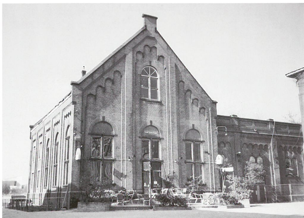
Haarlem: voormalige Stedelijke Gasfabriek