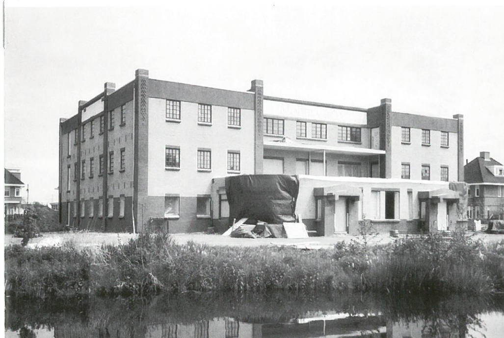
Sassenheim: voormalige bollenschuur

Aan de Teylingerlaan in Sassenheim staat een van de meest imponerende bollenschuren van de bollenstreek: de voormalige bollenschuur van de firma Papendrecht en Van der Voet. Deze indrukwekkende 'bollenburcht' is gebouwd in 1929-1930 door de Sassenheimse aannemer Oudshoorn. In dit bedrijfsgebouw werden niet alleen bollen opgeslagen, maar was ook ruimte gecreëerd voor een kantoor en productieruimten, waar de bollen werden gepeld, gesorteerd, geteld en verpakt.