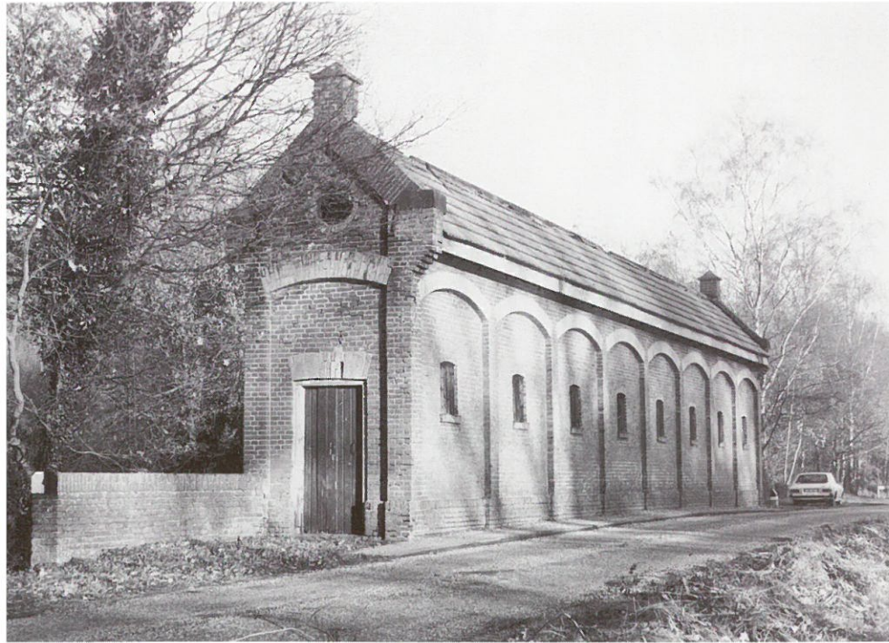
Denekamp: schuivenhuisje