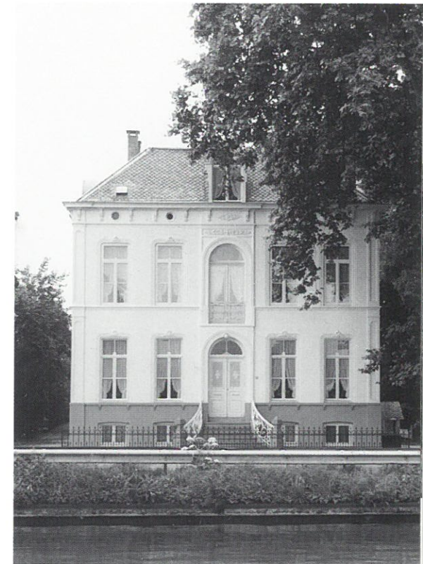
Helmond: fabrikantenvilla Raymakers

De stichting Baet en Borgh zet zich al jaren in voor het behoud van het stoomgemaal De Tuut in Appeltern, het laatste oude stoomgemaal in het land van Maas en Waal. In mei 2004 kon de restauratie van het gemaal worden afgesloten met het in werking zetten van de tweede stoommachine, die nog dateert uit de bouwtijd van het gemaal (1918).