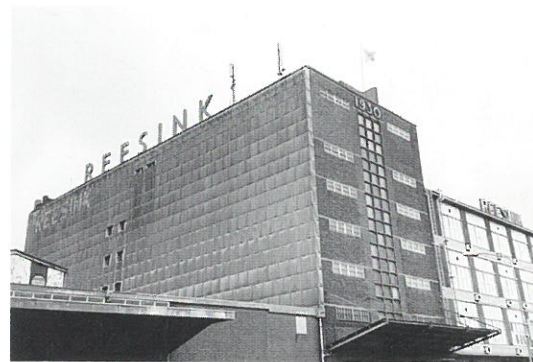
Zutphen: pakhuis firma Reesink

Eibergen • Op het fabrieksterrein van de voormalige textielfabriek KTV in Eibergen zal de komende jaren een compleet nieuwe woonwijk verrijzen. In de nieuwe woonwijk zullen enkele onderdelen van het fabriekscapitaal geïntegreerd worden, zoals de schoorsteen, het ketelhuis, een bedrijfshal met sheddaken en de voormalige bedrijfswinkel van de fabriek. Ook zal het riviertje de Berkel, dat in het verleden verschillende malen is verlegd, weer zijn oorspronkelijk bedding krijgen. De Koninklijke Textielverdelings Industrie (KTV) werd in 1830 gesticht door de fabrikant G.J. ten Kate. Voor het textielverdelingsproces werd gebruik gemaakt van het water van de Berkel. In de loop der jaren werd de loop van de Berkel diverse malen verlegd vanwege de noodzakelijke uitbreidingen van de fabriek. KTV is bezig met plannen om te verhuizen naar een nieuw bedrijfsterrein, waarna het vrijkomende terrein beschikbaar komt voor nieuwe woningbouw. De voorlopige plannen voor de herinrichting van het fabrieksterrein worden gemaakt door IAA Architecten uit Enschede. Het initiatief voor deze plannen ligt bij projectontwikkelaar Ter Steege Vastgoed uit Rijssen.