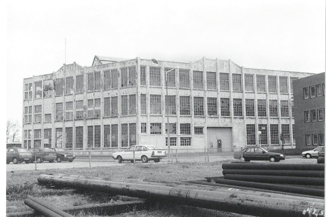
Vlissingen: timmerfabriek De Schelde