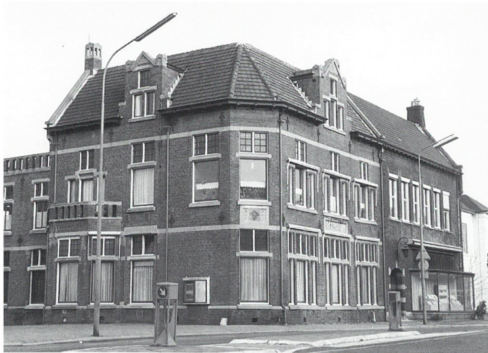
Apeldoorn: kantoor gasfabriek