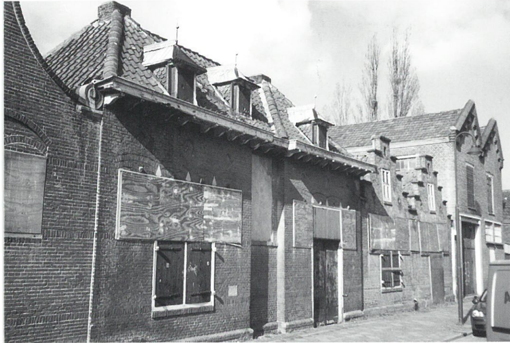
Gouda: plateelbakkerij Zuid-Holland