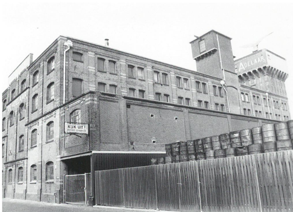
Wormerveer: zeepziederij