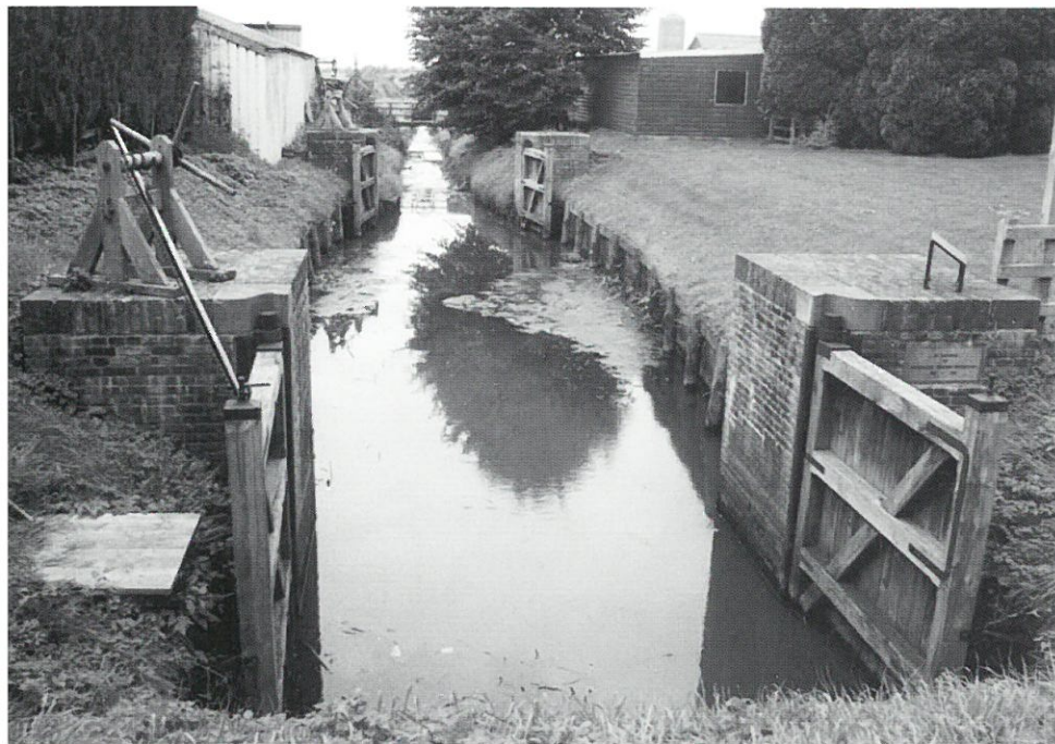
Drents waterwerk: schutsluisje bij Meppel

Op woensdag 11 mei organiseert FIEN een eendaagse excursie naar het Duitse Rheine. In deze oude textielstad zullen enkele interessante historische textielfabrieken en een saline (zoutfabriek) worden bezocht. In het textielmuseum Rheine wordt de tentoonstelling Cotton mills for the continent; Sidney Stott en de Engelse spinnerijen in Munsterland en Twente bezocht. Deze tentoonstelling geeft een beeld van de tussen 1880 en 1914 in Munsterland en in Enschede gebouwde grote textielfabrieken, ontworpen door de uit het Engelse Oldham afkomstige architect Sidney Stott. Hij ontwierp imposante fabrieksgebouwen, met gietijzeren kolommen, stenen vloeren, sprinklerinstallaties en watertorens. Deze immense fabrieken hebben jarenlang het stadsbeeld bepaald van industriesteden in Twente en Munsterland.