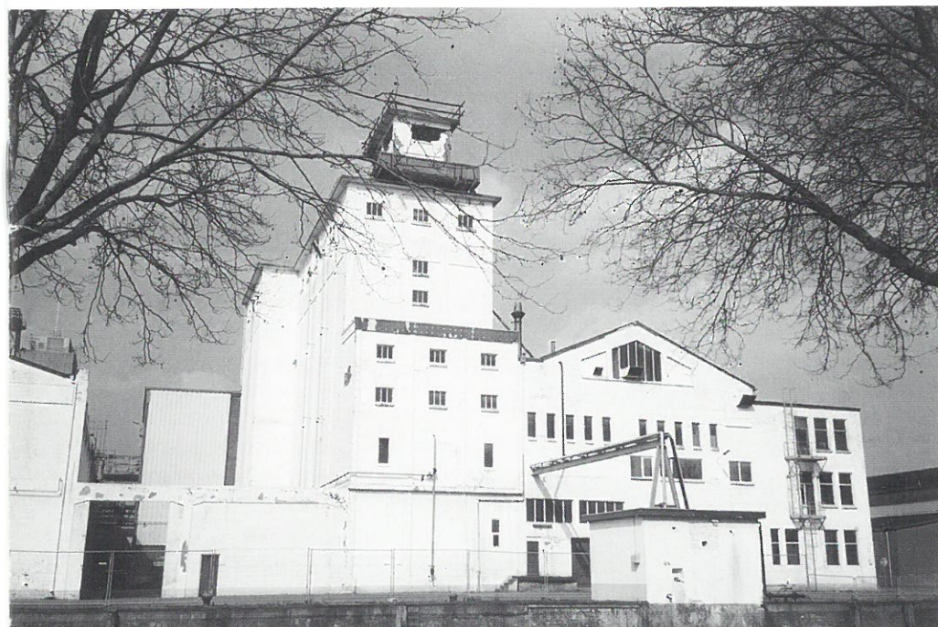
Veghel: veekeukenfabriek NCB

Tussen 1822 en 1846 werd in Noord-Brabant de Zuid-Willemsvaart gegraven. Het kanaal was bestemd voor het transport van bulkgoederen tussen de Noordelijke en Zuidelijke Nederlanden.