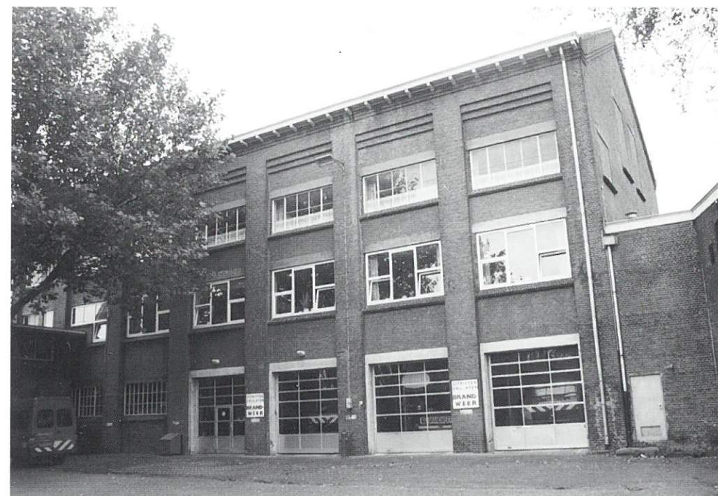
Meppel: voormalige gasfabriek

folders, brochures, boekenleggers, reclamebriefkaarten en sluitzegels. Tijdens de tentoonstelling is er een doorlopende voorstelling van vooroorlogse reclamefilmjes. Naar aanleiding van de Frits-Philipsmanifestatie verschijnt ook een boek onder de titel Kunst in de Philips-reclame (1891-1941) . Het boek behandelt de Philipsreclame die voor de oorlog grote faam genoot vanwege de professionele ontwerpen.