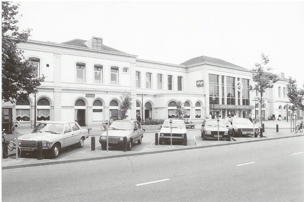
Alkmaar, station