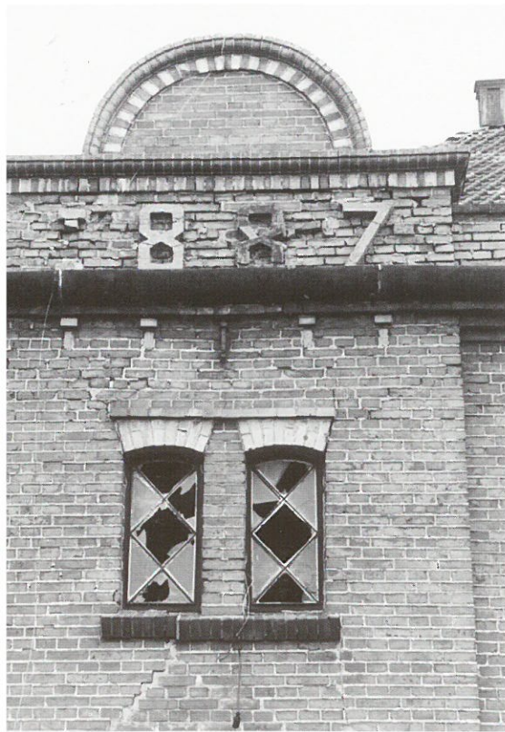
Muntendam, steenfabriek

Muntendam • Het vervallen fabriekscomplex van de voormalige Muntendammer steenfabriek is in mei j.l. gesloopt. Hiermee kwam na jaren van leegstand en verwaarlozing het einde voor een van de laatste gave steenfabrieken van de provincie. De steenfabriek werd in 1887 gebouwd aan het Meedenerdiep. Naast de fabriek werd later een kalkbranderij gebouwd, zodat er sprake was van een uniek industrieel ensemble. De laatste kalkoven werd eind jaren tachtig van de vorige eeuw gesloopt. In 1893 werd de fabriek herbouwd na een brand. In 1904 werd het bedrijf overgenomen door de familie Holthuis, die er draineerbuizen ging fabriceren voor de export naar Ierland. Eind jaren zestig werd de productie beëindigd en werd de steenfabriek gesloten.