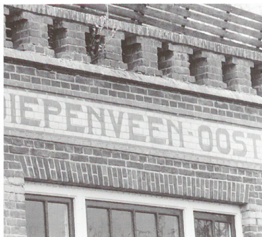
Diepenveen, tegeltableau station

Diepenveen • Op 5 juni werd in het centrum van Diepenveen, even ten noorden van Deventer, een Spoorwegmonument onthult. Het monument bestaat uit een tegeltableau, afkomstig uit het voormalige station Diepenveen-Oost. Het tegeltableau met de stationsnaam is hersteld en ingemetseld in een bakstenen bank, die is geplaatst tegenover de plek waar het station heeft gestaan. Station Diepenveen-Oost werd in 1910 gebouwd aan de spoorlijn van Deventer naar Ommen door de Overijssel Lokaal Spoorweg Maatschappij (OLDO). Deze weinig rendabele spoorlijn werd al in 1935 weer opgeheven.