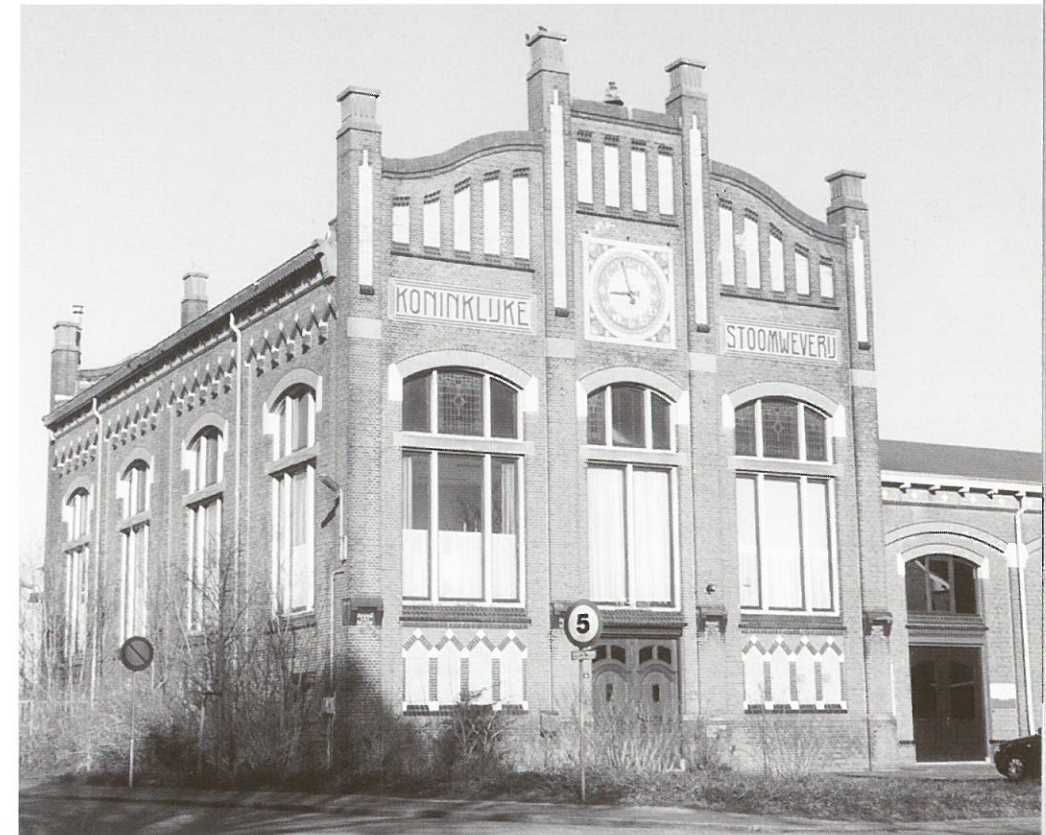
Nijverdal, Turbinehal

De fabriekspanden die tot rijksmonument zijn aangewezen behoren tot de fraaiste voorbeelden van fabrieksarchitectuur in Overijssel. Het betreft de in Art-Nouveau opgetrokken turbinehal (1912), de oudste fabriekshallen met sheddaken (1852) en het kantoorgebouw (1911). Ten Cate Fashion is tegen de aanwijzing van bovengenoemde panden omdat dit een mogelijke toekomstige aanpassing/modernisering van de gebouwen in de weg zou staan. Overigens heeft Ten Cate Fashion in een overleg met de gemeente Hellendoorn wel gemeld achter het behoud van de nu leegstaande turbinehal te staan. Woordvoerder F. Spaan van het bedrijf noemt de turbinehal zelfs 'het visitekaartje' van de Twentse textielindustrie. Mogelijk zou de turbinehal een nieuwe functie kunnen krijgen als bezoekerscentrum en als permanente expositieruimte over de geschiedenis van de textielindustrie in Twente.