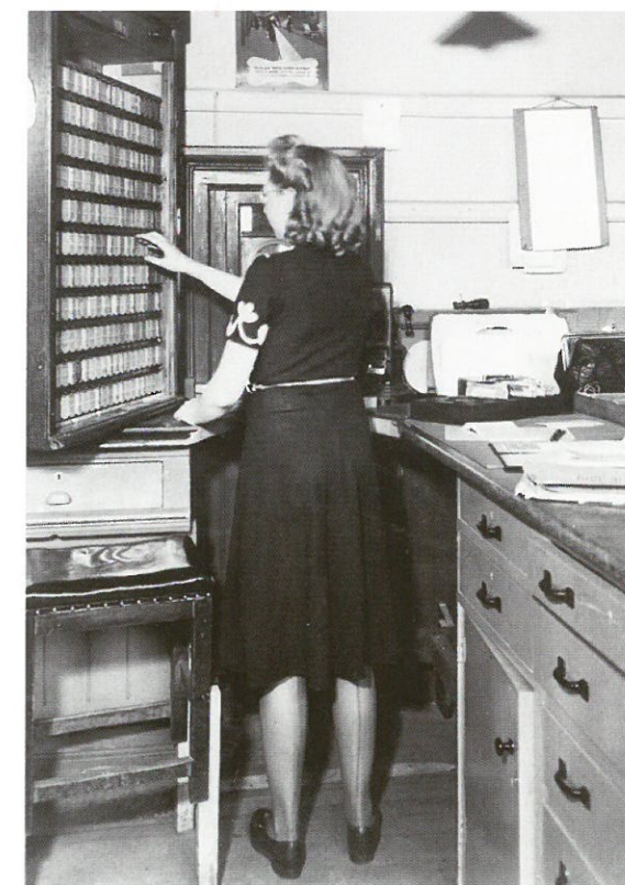
Kaartverkoop station Barneveld jaren '50

In het Nederlands Scheepvaartmuseum in Amsterdam is tot 15 februari deze expositie te zien over vuurtorens en lichtschepen in de acht landen die grenzen aan de Noordzee. De tentoonstelling voert de bezoeker onder andere langs de befaamde Lange Nelle in Oostende, de al even bekende Lange Jaap in Den Helder, de robuuste vuurtoren van Lindesnes in Noorwegen en het 'lichtpaleis' van ingenieur Stevenson op het Engelse eiland May. De tentoonstelling Lichten langs de Noordzee mag gezien worden als een historisch document waarin opkomst en ondergang van vuurtoren en lichtschip op boeiende wijze worden belicht. De tentoonstelling is een gezamenlijk project van een achttal musea in de landen die grenzen aan de Noordzee. ►