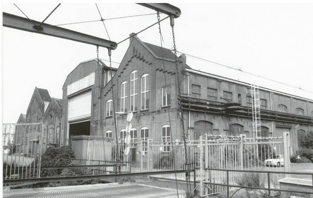
Amsterdam, Storkfabrieken