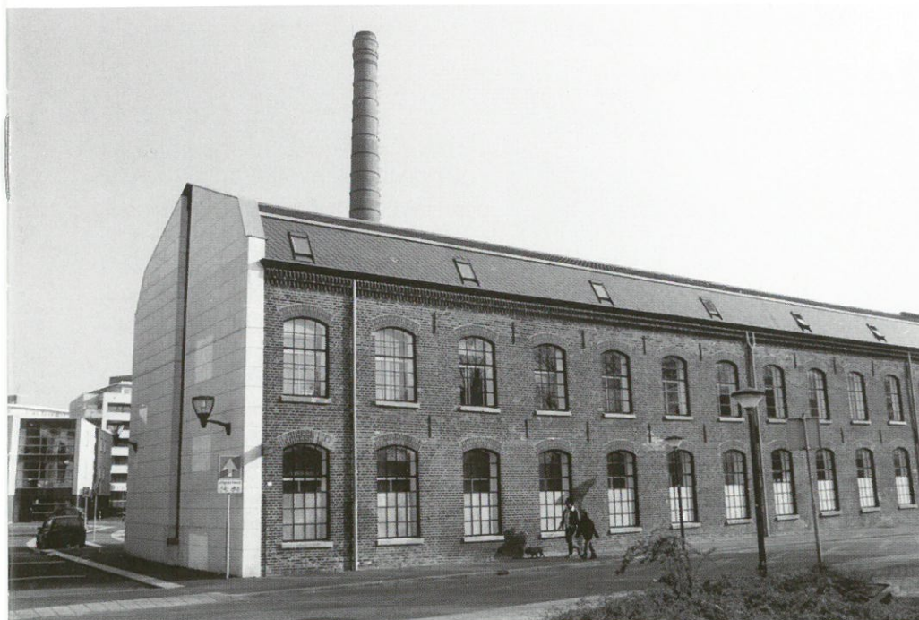
Wollenstoffenfabriek Van de Heuvel, Geldrop

Sinds het midden van de negentiende eeuw ontwikkelde het oosten van de provincie Noord-Brabant zich tot een centrum van textielnijverheid. In Tilburg en Geldrop werden fabrieken gesticht die zich specialiseerden in de productie van wollen stoffen.