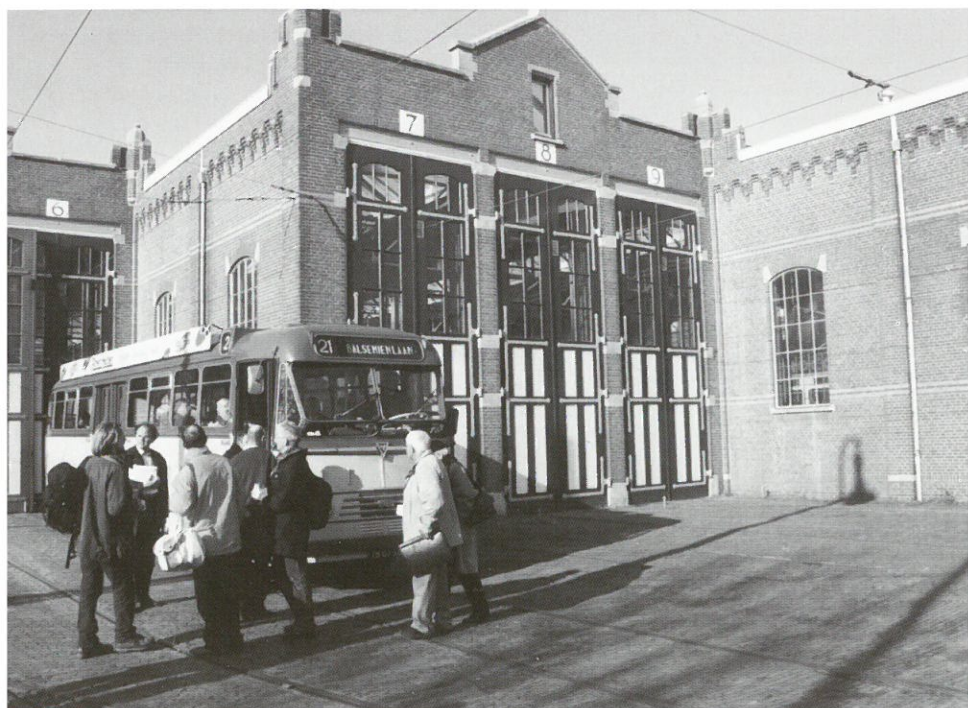
FIEN-excursie 9 november 2003

op 8 november hield FIEN de najaarsvergadering in Den Haag. Deze locatie was gekozen vanwege het tienjarig bestaan van de Stichting Haags Industrieel Erfgoed (SHIE). Op de vergadering, die werd gehouden in het Haags Openbaar vervoer Museum in de historische tramremise van de HTM, waren ca. 25 vertegenwoordigers van aangesloten organisaties aanwezig.