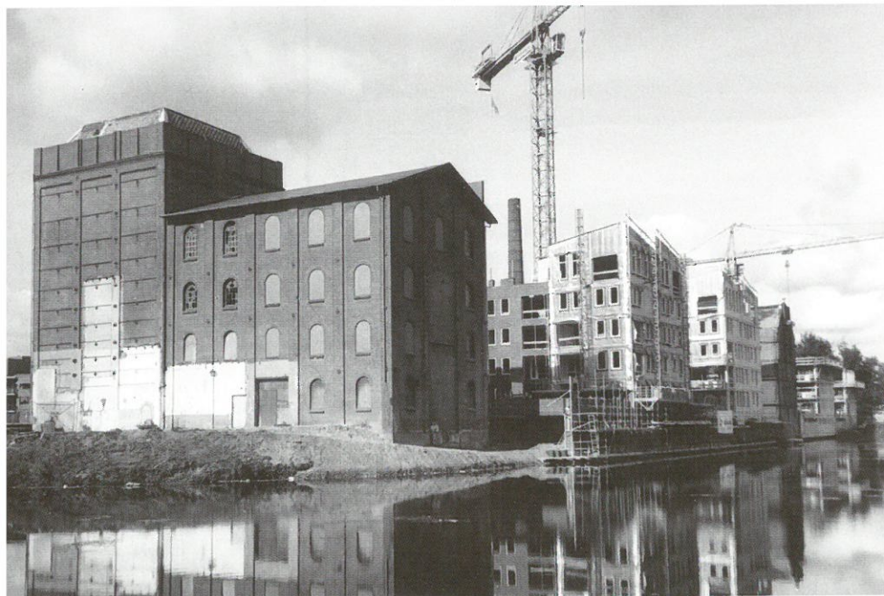
Deventer, industriegebied Raambuurt