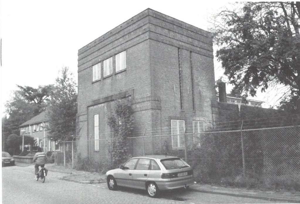
Apeldoorn, trafostation

De gemeente Apeldoorn, de woningstichting De Goede Woning en projectontwikkelaar Bouwfonds hebben plannen ontwikkeld voor de bouw van een nieuwe woonwijk, die deels zal worden gerealiseerd op het terrein van een transformatorstation van de NUON.