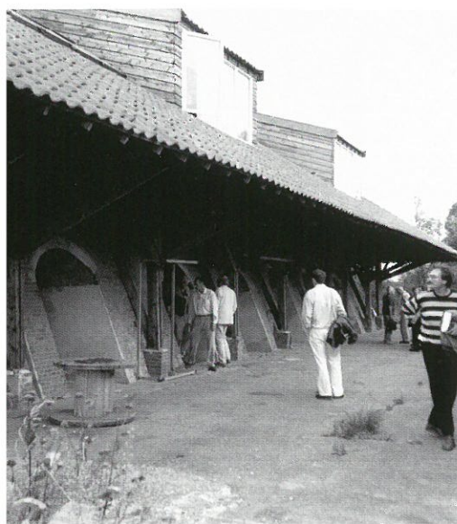
Excursie FIEN: steenfabriek De Bovenste Polder

De toegangsprijs per filmvoorstelling bedraagt € 5,50. Reserveringen: telefoon (038) 423 06 80. »