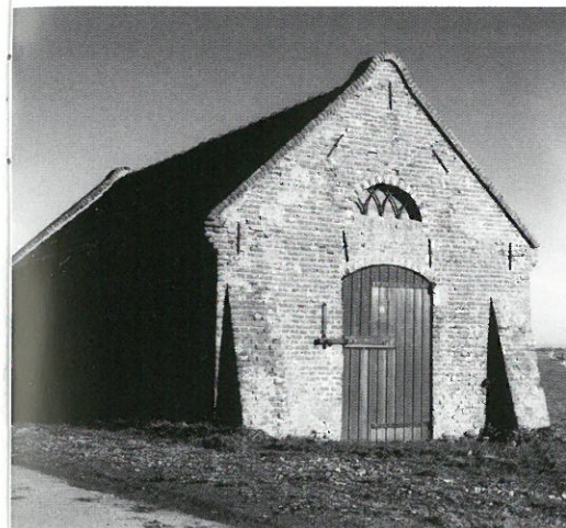
Oosterwolde: polderschuur

Oosterwolde • aan de Zomerdijk in het Noordveluwe dorp Oosterwolde staat een voormalige polderschuur. De vervallen bakstenen schuur werd in de tweede helft van de negentiende eeuw gebouwd als opslagloods voor balken, die in tijden van hoog water werden gebruikt voor de versterking van uitwateringsluizen. De polderschuur is niet meer in