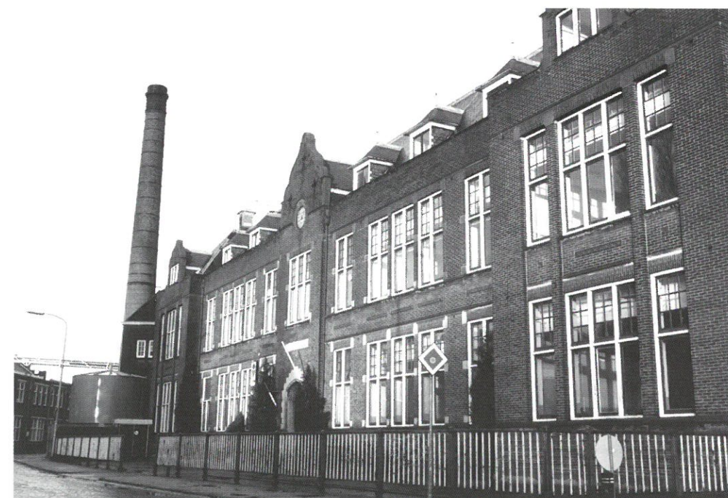
Fabrieksschool Stork

De STIEL heeft in september een wandelgids uitgegeven onder de titel Langs Leidse winkelpanden . Bijzondere aandacht wordt in het boekje gegeven aan de talrijke jugendstilwinkelpanden in de Leidse binnenstad. Er worden 37 panden beschreven, met zwart-witfoto's. Tot de beschreven panden behoort ook een aantal winkel- en bedrijfspanden van de kleine nijverheid, zoals drukkerijen, meubelmagazijnen, kantoren en een 'vleeschhouwerij'. Het boekje telt 80 bladzijden en is in de Leidse boekwinkels verkrijgbaar voor € 4,60. Meer informatie: www.industrieel-erfgoed.nl/leiden.