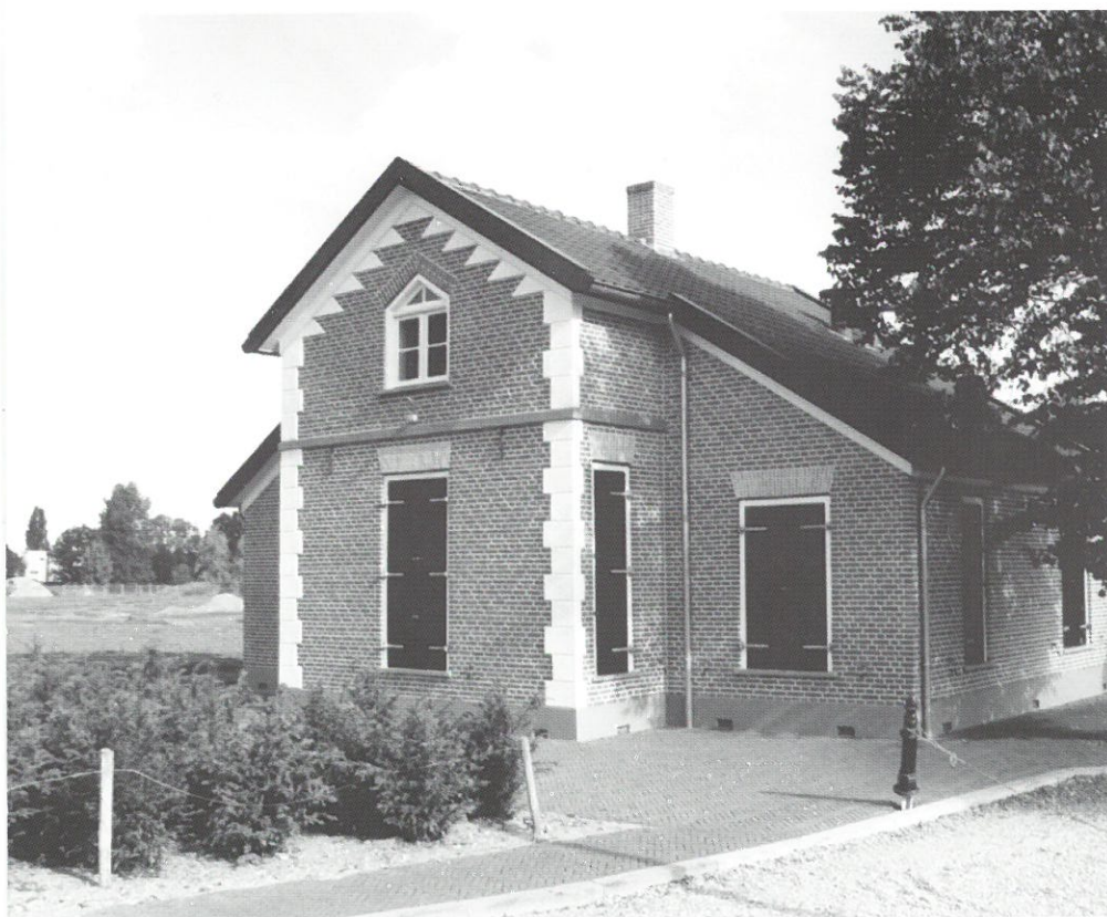
Restaurant De Brugwachter in Apeldoorn