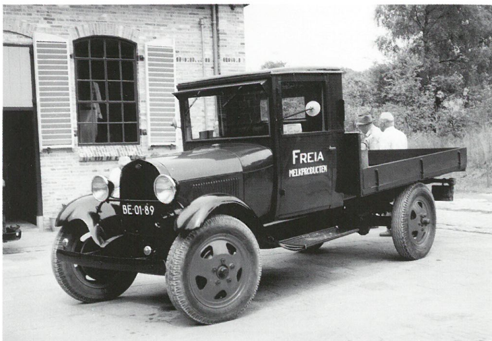
Mobiel erfgoed: vrachtwagen in Openluchtmuseum