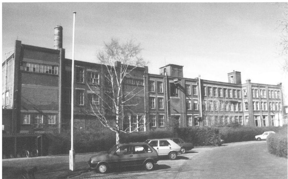
Veendaal: Hollandia-wolfabriek

jaren buiten bedrijf en wordt sinds kort beheerd door de Stichting Museum De Middelste Molen. Het bestaande molencomplex dateert van 1887 en is de laatste nog geheel complete, op stoomkracht aangedreven papierfabriek van de Veluwe. Al in 1663 was op deze plaats een papierwatermolen in bedrijf. Het interieur van de papiermolen verkeert nog geheel in de staat van 1887, met twee oude papierpersen met een stenen kollerengang en een stoommachine uit 1900.