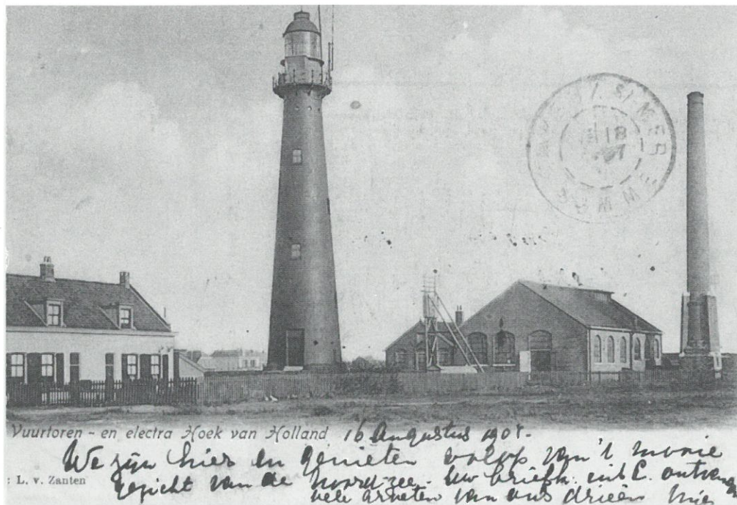
Oude prentbriefkaart van een vuurtoren, Hoek van Holland: vuurtoren ca 1900