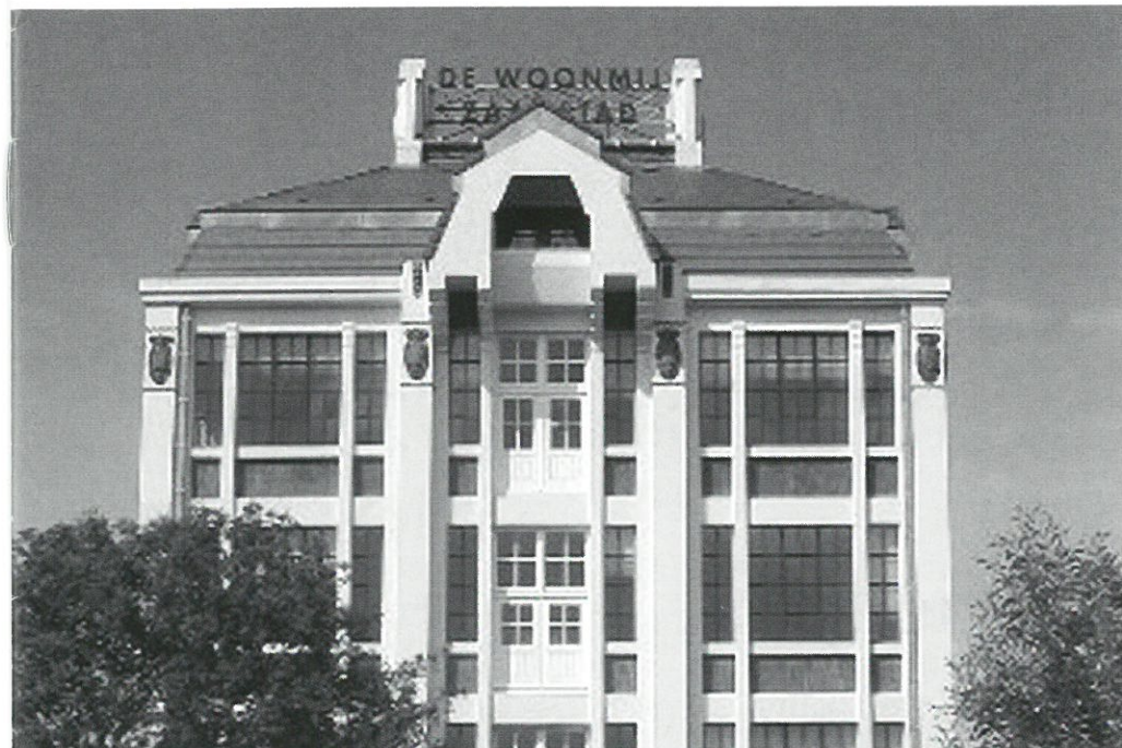
Wormerveer, cacaooren firma Pette na restauratie

Onlangs is de restauratie voltooid van de chocoladefabriek van de firma J. Pette HZN, aan de Marktstraat in het centrum van Wormerveer. In 1873 stichtte de ondernemer Pette op deze plaats een cacaofabriek, als opvolger van de uit de zeventiende eeuw daterende cacaooven De Arend.