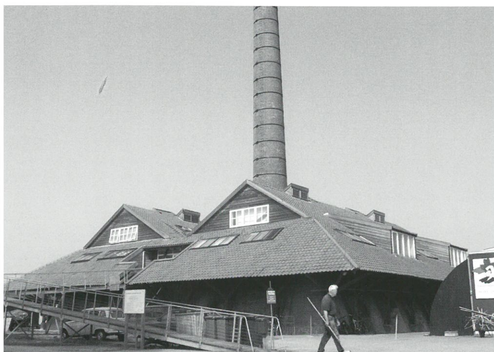
Steenfabriek De Bovenste Polder