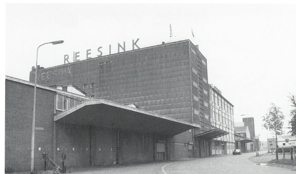
Zutphen: IJzerwarenpakhuis firma Reesink

De ZIE heeft onlangs haar nieuwe website gepresenteerd. Op de website vindt de bezoeker een inleiding in de geschiedenis en de doelstelling van de ZIE, een fotoreportage van industriële monumenten in de Zaanstreek, een overzicht van de door de ZIE gepubliceerde rapporten en actueel nieuws over de stichting. De ZIE is de opvolger van de Vereniging tot behoud van Monumenten van Bedrijf en Techniek in de Zaanstreek (MBTZ), die