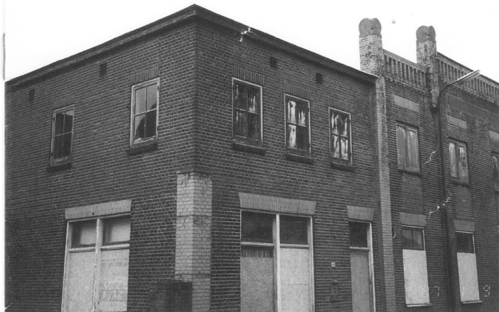
Hillegom, voormalige bollenschuur aan de Wilhelminalaan

In het midden van de jaren negentig ontstond er meer aandacht voor het behoud van bollenschuren, het voor de Bollenstreek zo karakteristieke agrarisch erfgoed. Bijna een derde van de cultuurhistorisch waardevolle bollenschuren in dit gebied is in vier jaar tijd verloren gegaan, zo blijkt uit een onderzoek dat in 2002 is uitgevoerd. De bollenschuur, aanvankelijk uit hout opgetrokken, vanaf de jaren twintig in steen en beton, werd gebruikt voor de opslag en het drogen van bloembollen. De vaak langgerekte gebouwen hebben smalle vensters die als ventilatieopeningen dienst doen.