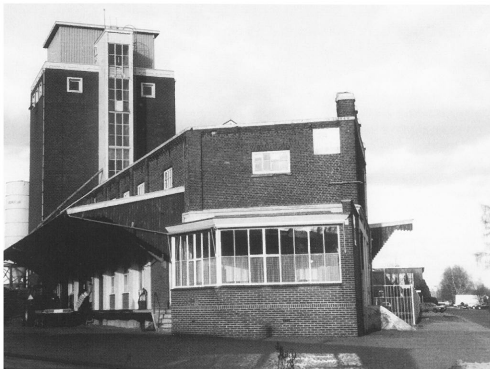
Haaksbergen, maalderij met graansilo