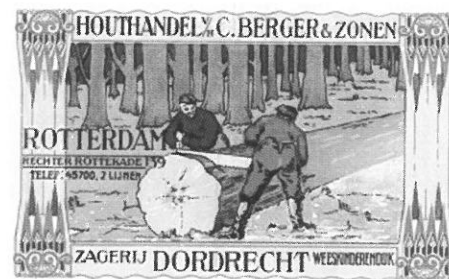
Briefhoofd Houtzagerij C. Berger & Zonen

Rotterdam, Gemeentearchief • Het gemeentearchief Rotterdam organiseert in samenwerking met de Kamer van Koophandel een tentoonstelling over historisch reclamemateriaal van Rotterdamse bedrijven. Aanleiding voor deze tentoonstelling is het tweehonderdjarig bestaan van de Rotterdamse Kamer van Koophandel in 2003. Het gemeentearchief bezit veel bedrijfsarchieven, die een goed overzicht bieden van het bedrijfsleven in Rotterdam door de eeuwen heen. Naast boekhoudingen en verslagen bewaart het archief ook bedrijfsreclames. Wie kent niet de beroemde affiches van de Holland-Amerika Lijn? Tot 1850 deden bedrijven nauwelijks iets aan reclame. Toen de markt begon te groeien, betekende reclame een nieuwe manier van concurreren. Herkenbaarheid speelde hierbij een grote rol. Vormgevers werden aangetrokken voor het ontwerpen van een uniforme stijl, de zogenaamde huisstijl. De diensten en producten van een goed bedrijf zijn op