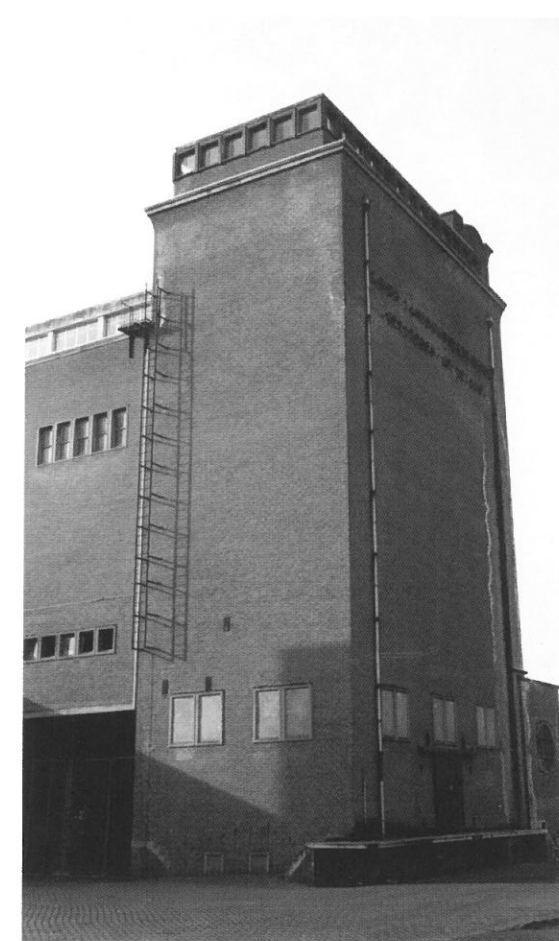
Borculo, graansilo

Geïnteresseerden die op zoek zijn naar een historische luchtopname van bijvoorbeeld een fabriek, bedrijfspand of woonplaats kunnen contact opnemen met Aviodome Luchtfotografie, telefoon (026) 3778390 of luchtfotografie@aviodome.nl »