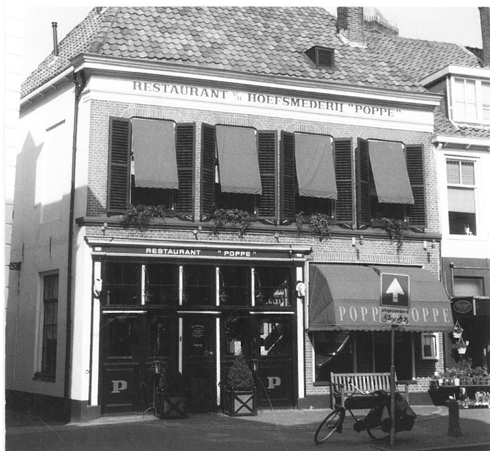
Restaurant Poppe in Zwolle