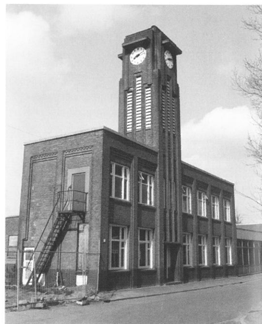
Kantoor textiel fabriek Hedeman

Almelo • In de wijk Sluiversveld is eind 2002 de voormalige textiel fabriek van de Fa. Hedeman met de grond gelijk gemaakt. Het Hedemancomplex, dat al jaren buiten bedrijf was, behoorde tot de laatste overgebleven grootschalige textiel fabrieken in Almelo. Het oorspronkelijke textielbedrijf werd eind negentiende eeuw opgericht, in 1941 werd het bedrijf overgenomen door