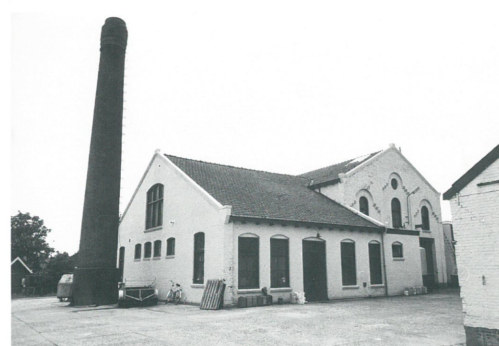
Appingedam, voormalige gasfabriek

Tzummarum • Het voormalige stationsgebouw van Tzummarum, gebouwd in 1902 voor de Noord-Friese Lokaal Spoorwegmaatschappij (NFLS), wordt sinds november 2002 gerestaureerd. Het stationsgebouw is aangekocht door DBF, een projectontwikkelingsmaatschappij uit Assen die met financiële steun van gemeenten, provincie en de Europese Unie vervallen industriële panden opknapt en een nieuwe bestemming geeft. Het in vervallen staat verkerende stationsgebouw wordt voor € 550.000 opgeknapt naar een ontwerp van architectenbureau Jelle de Jong uit Lemmer. Bij de restauratie wordt het gebouw voor een groot deel in de oorspronkelijke staat hersteld, met als bijzondere onderdelen het kaartjesloket en het peron. Na de restauratie zal het stationsgebouw dienst gaan doen als kantoorruimte.