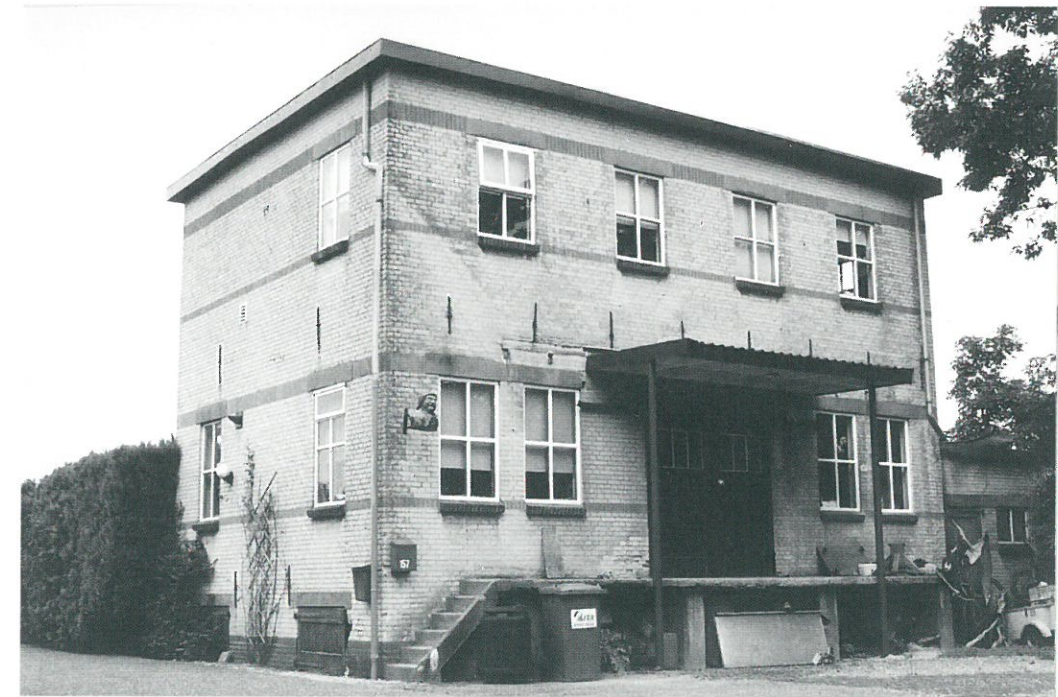
Okkenbroek (Salland), voormalige zuivelfabriek

Bezoekerscentrum West-Salland, Canadastraat 6, Heino. Telefoon (0572) 394561. Geopend van maandag t/m zaterdag 10.00-13.00; toegang gratis. ■