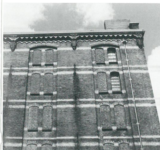
Amsterdam, pakhuis Australië