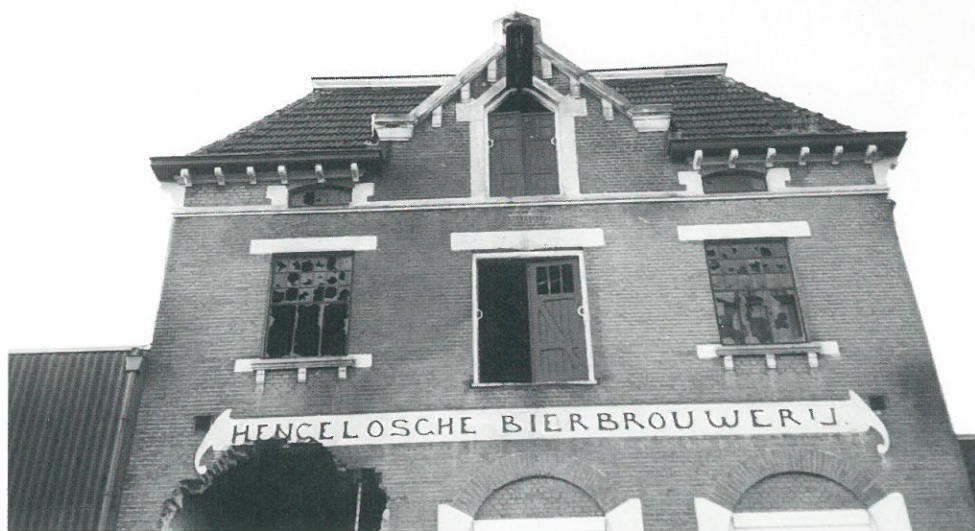
Hengelo, voormalige bierbrouwerij