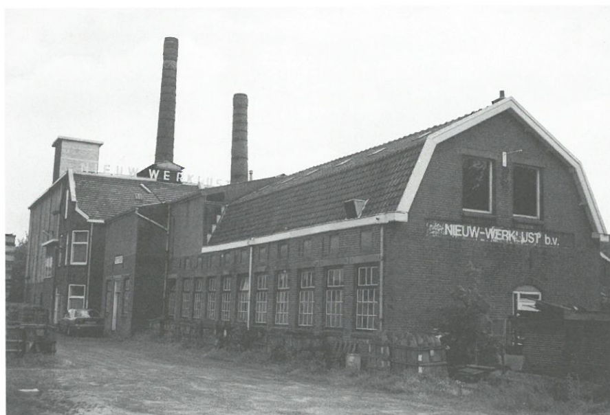
Nieuw-Werklust, foto Wibo Burgers