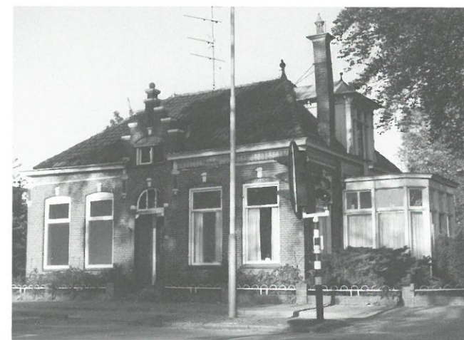
Villa Erica

Groningen: een van de laatste schoorstenen in de gemeente Groningen is begin mei onverhoeds tegen de vlakte gegaan. De schoorsteen was het laatste restant van de voormalige steenfabriek 'Eureka' uit 1917, waarvan de ovens in 1980 werden gesloopt. De ingekorte, door roet zwartgeblakerde schoorsteen vormde een bijzonder 'landmark' aan de rand van de stad Groningen langs het Boterdiep. Het terrein rondom de schoorsteen werd begin dit jaar bebouwd met een megabouwmak van het Duitse bedrijf Hornbach. Voor de schoorsteen, die het bedrijf blijkbaar in de weg stond, werd op 24 april een sloopvergunning aangevraagd, maar nog voor de vergunning werd verleend schakelde het bouwbedrijf een sloopploeg in die de schoorsteen neerhaalde. De gemeente Groningen zal volstaan met het opleggen van een boete aan het Duitse bedrijf. Inmiddels heeft de illegale sloop van de schoorsteen echter tot een storm van protest geleid en zijn er ook in de gemeenteraad kritische vragen gesteld. Er is inmiddels een actiegroep opgericht onder de naam 'herbouw Pijp', met als doelstelling de schoorsteen weer op te bouwen.