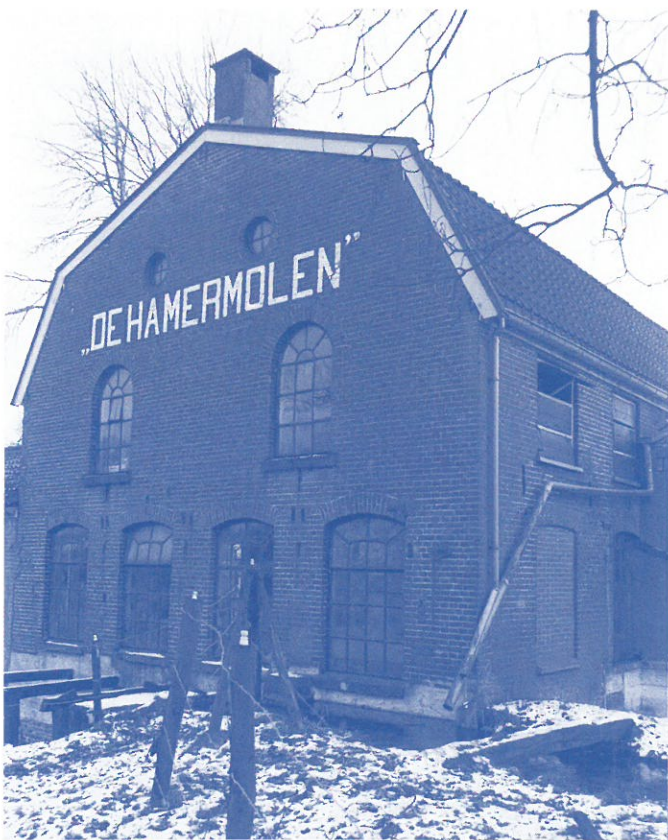
Ugchelen, De Hamermolen

Dankzij een financiële bijdrage van ca. 2 miljoen euro van de provincie Overijssel is het herstel van de steenfabriek 'Werklust' mogelijk gemaakt. De gemeente Losser stond achter het behoud van de steenfabriek, en heeft concrete plannen ontwikkeld om de fabriek straks een functie te geven in het kader van de Landesgartenschau 2003, een grensoverschrijdende tuinmanifestatie. In de eerste fase van de restauratie zal de fabriek toegankelijk voor bezoekers worden gemaakt, in een volgende fase zal het definitieve herstel van de fabriek in de oorspronkelijke staat worden aangepakt.