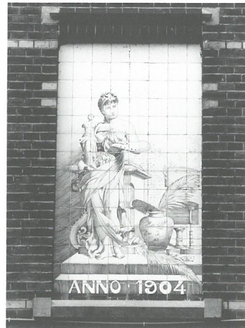
Tegeltableau fabriek Ravesteijn Utrecht

1. Muurreclames in Utrecht. Utrecht, gemeente Utrecht, Werkgroep directe voorzieningen, 2002. 48 blz., ill. krtn. Prijs € 2,-.