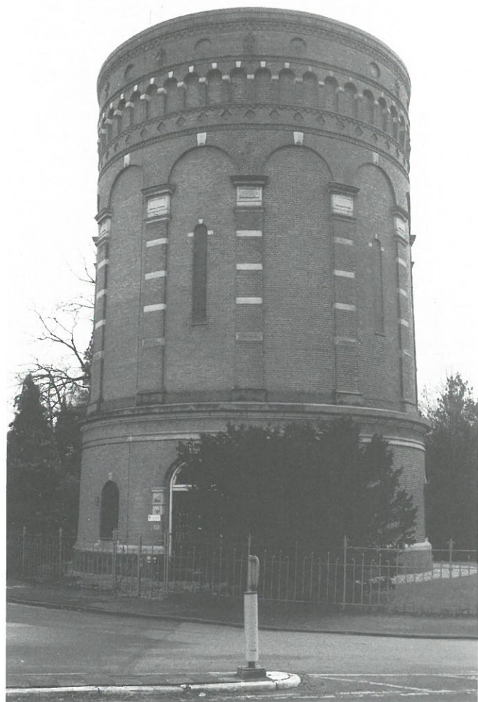
Watertoren Hilversum

De watertoren dateert uit 1893 en is gebouwd op het hoogste punt van Hilversum, zodat de hoogte van de toren beperkt kon blijven tot 25 meter. De watertoren wordt uitwendig gerestaureerd, en het puntdak dat er in de Tweede Wereldoorlog af is gesloopt door de Duitsers wordt weer opgebouwd. De watertoren zal naar verwachting na de restauratie nog vijf jaar in gebruik blijven.