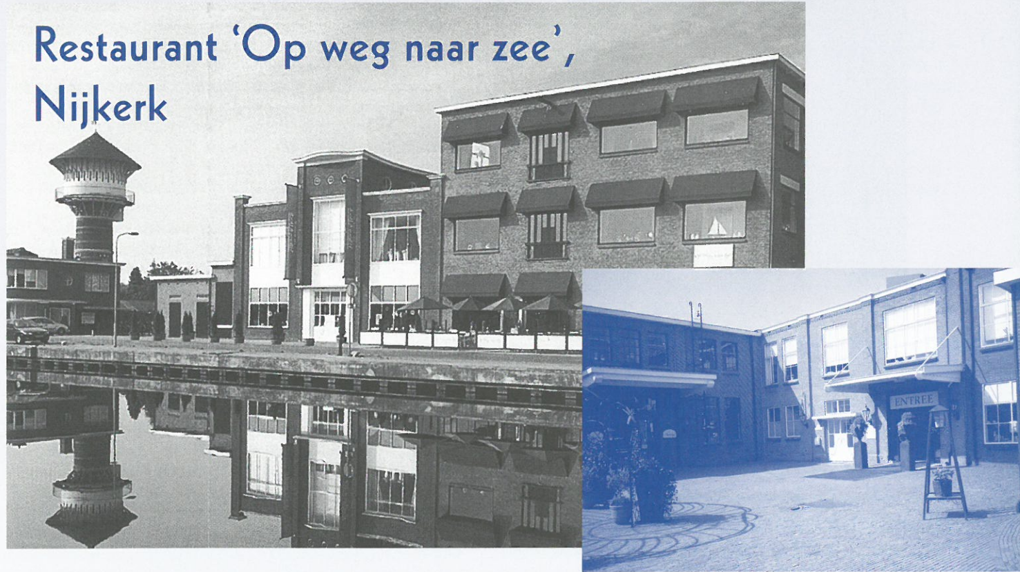
Restaurant Nijkerk, met links de watertoren.

Aan de Westkadijk, de oude verbindingsweg langs de Arkervaart tussen Nijkerk en de vroegere Zuiderzee, ontstond reeds in de achttiende eeuw een bedrijventerrein. Achtereenvolgens vestigde zich hier een glas-, matten-, radiofabriek en de Zaanlandse Cacaofabriek die na de tweede wereldoorlog door de chocoladefabriek 'De baronie' (Belgische bonbons, drop, chocolade) werd overgenomen. In 1995 werden de bedrijfsactiviteiten gestaakt en het machinepark van de chocoladefabriek ontmantelt. Op initiatief van het Nijkerkse echtpaar van Doogemaar is er sinds 1998 in de bestaande gebouwen het woonshoppingcentrum 'De Havemaer' gevestigd. De originele infrastructuur zowel extern (raampartijen, deuren, entree, sheddaken) als intern (leidingstraten, pilaren, machine-, inpak en opslagruimte) is gehandhaafd bij de verbouwing. De winkels pasten er wonderwel in, zodat het woonshoppingcentrum ondanks de moderne uitvoering de sfeer van oude bedrijvigheid uitstraalt. Een chique tegelwinkel bijvoorbeeld heeft de oor-