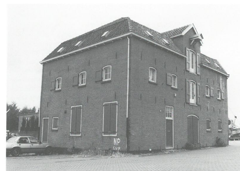
Graanpakhuis Eemkwartier, Amersfoort

Bunschoten: In de gemeente Bunschoten wordt een inventarisatie gemaakt van waardevolle gebouwen uit de periode van de wederopbouw. Een van de gebouwen die zijn geïnventari-