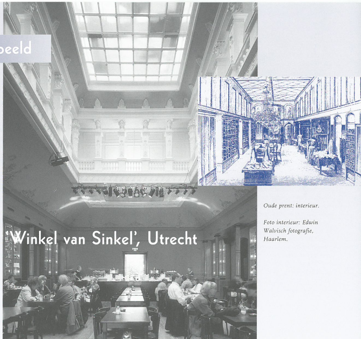
Oude prent: interieur.