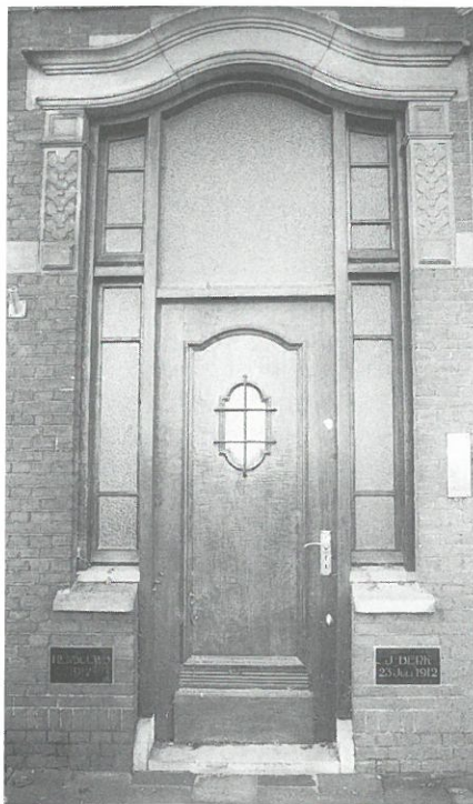
Kampen: 'Berk', entree kantoor.

terrein ontwikkelt het bouwbedrijf Mateboer een plan voor nieuwbouw van woningen, waarbij de locatie aan de IJssel natuurlijk zeer in trek is bij gegadigden. In de oorspronkelijke plannen zouden de Berkgebouwen gesloopt worden, maar de provincie heeft aangedrongen op handhaving van enkele markante bedrijfs panden. Om de plannen in deze zin bij te stellen is nu het Rotterdamse stedenbouwkundige adviesbureau Kuiper en Compagnons ingeschakeld, die eerder al in kampen op verzoek van de gemeente een herinrichtingsplan maakten voor het reconstrueren van de gedempte Buitenhaven.