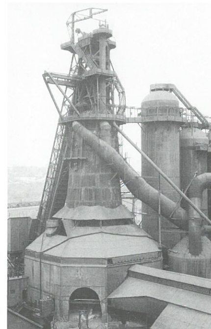
Hochofen, Youngstown, Ohio, USA, 1981.

De Erasmusprijs 2002 is toegekend aan het Duitse fotografenpaar Bernd (70) en Hilla (67) Becher. Het echtpaar krijgt de culturele onderscheiding vanwege hun grote verdiensten op het gebied van de nieuwe, registrerende fotografie als kunstvorm. De Erasmusprijs, waaraan een prijs van € 150.000,- is verbonden, wordt jaarlijks toegekend aan een persoon of instelling die een belangrijke rol heeft gespeeld op cultureel, sociaal of sociaal-wetenschappelijk terrein in Europa.