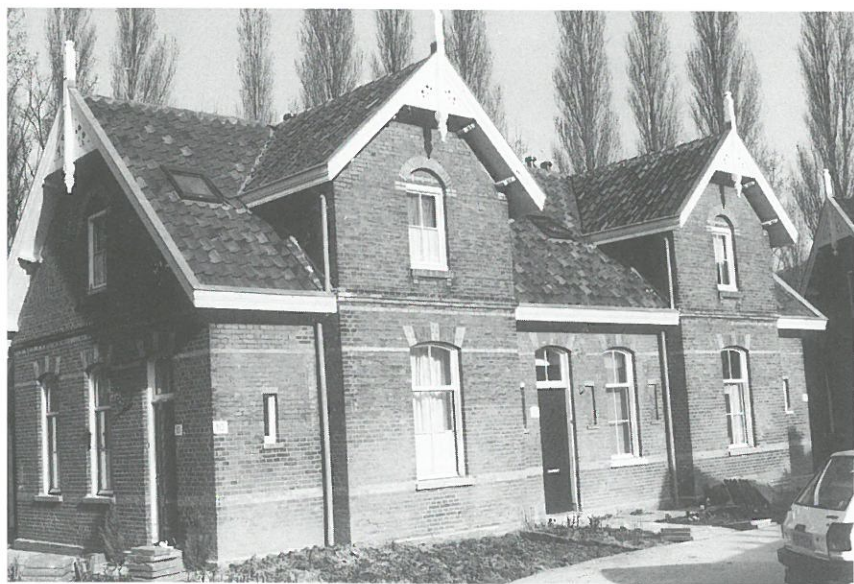
Delft: fabriekswijk 'Agnetaapark'.

Het museum zal worden gehuisvest in de oude fabrieksgebouwen van de voormalige DRU-fabriek in Ulft. Op deze historische plek werd al in de achttiende eeuw ijzer verwerkt in hoogovens. Het beoogde fabriekscomplex dateert uit de periode 1870-1920 en staat op de nominatie om Rijksmonument te worden. De Nationale Maatschappij tot Behoud, Ontwikkeling en Exploitatie van Industrieel Erfgoed (BOEI) is begonnen met een haalbaarheidsonderzoek om de fabrieksgebouwen te herstellen en een museale functie te geven. In het museumconcept gaat men uit van een brede opzet en het aanbieden van een geïntegreerd pakket van voorzieningen, zoals een vaste en wissel-