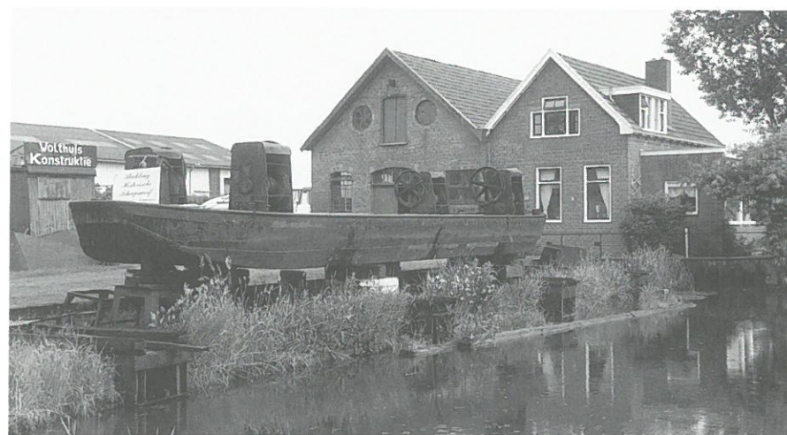
Sappemeer: scheepswerf Wolthuis.

Kampen: De provincie Overijssel heeft kritiek geuit op de bouwplannen voor het voormalige fabrieksterrein van de Fa. Berk-Kampen, gelegen ten noorden van de oude stadskern aan de rivier de IJssel. Op het fabrieksterrein staan een aantal cultuurhistorisch waardevolle fabrieksgebouwen uit het begin van de twintigste eeuw. Het complex is een herinnering aan de ooit voor Kampen zo belangrijke emaillefabriek van de Fa. Berk. Het bedrijf, dat vooral potten en pannen voor de huishouding fabriceert, is sinds enige jaren verhuisd naar een andere locatie. Op het terrein bevinden zich nog de voormalige directeurswoning, het entreegebouw met fabriekspoort uit de dertiger jaren, een productiegebouw met ingebouwde fabriekswatertoren en enkele productiehallen. Een deel van de gebouwen is als ateliersruimte bij kunstenaars in gebruik, maar de meeste gebouwen staan leeg en zijn inmiddels voor een deel door brand aangetast. Voor het fabrieks-