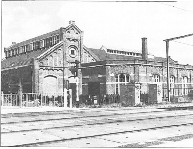
Amsterdam: hydraulische centrale (1885).

dig gedecoreerde baksteenstijl als het oorspronkelijke gebouw. In 1951 werd de centrale buiten dienst gesteld en kreeg een nieuwe functie als gelijkrichterstation. De laatste jaren diende het gebouw alleen nog als opslagruimte.