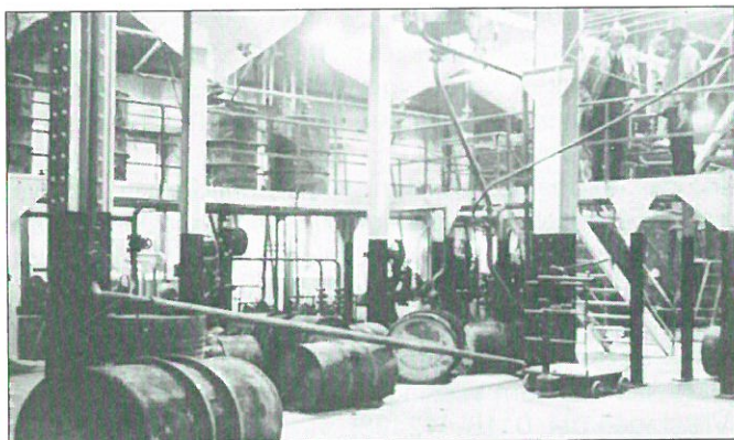
Zwolle, interieur oliefabriek Reinders ca. 1935. (Fotocollectie gemeentearchief Zwolle).

Op de historische opnamen staan ondermeer afgebeeld het personeel van de fabriek in 1900 en interieur- en exterieuropnamen van de fabriek in het begin van de twintigste eeuw. De oliefabriek van de fa. Reinders werd in 1865 opgericht onder de naam 'De Aloë' aan de Nieuwe Vecht in Zwolle. De fabriek groeide in de loop der jaren uit tot één van de grootste industriële bedrijven van Zwolle. In 1970 werd de fabriek overgenomen door de fa. Golden Wonder. In 1989 werd het bedrijf gesloten en het merendeel van de bedrijfsgebouwen gesloopt. Alleen het portiershuis uit 1916 bleef behouden. Dit pand zal als industrieel erfgoed bewaard blijven. De tentoonstelling is tot 1 oktober te bezichtigen in het gemeentearchief, Voorstraat 26 te Zwolle (tel. 038-4982488).