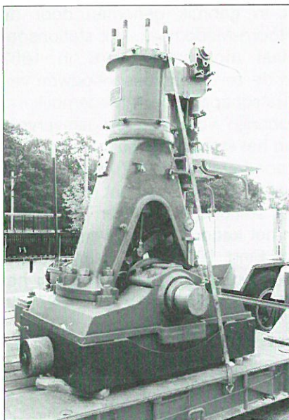
KERKRADE: transport machine naar museum 'Industrion'

De Micheletti Award bestaat sinds 1996 en werd in voorgaande jaren uitgereikt aan het DASA Museum in Dortmund, Het Municipal Museum in Slovenië, het Ecomuseum Bergslagen in