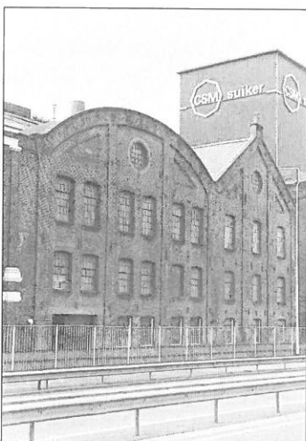
HALFWEG: Suikerfabriek C.S.M.(1863).

In 1992 werd het bedrijf stilgelegd en de productie overgenomen door de CSM-vestigingen in Breda en Groningen. De laatste jaren werd het fabriekscomplex alleen voor opslag gebruikt.