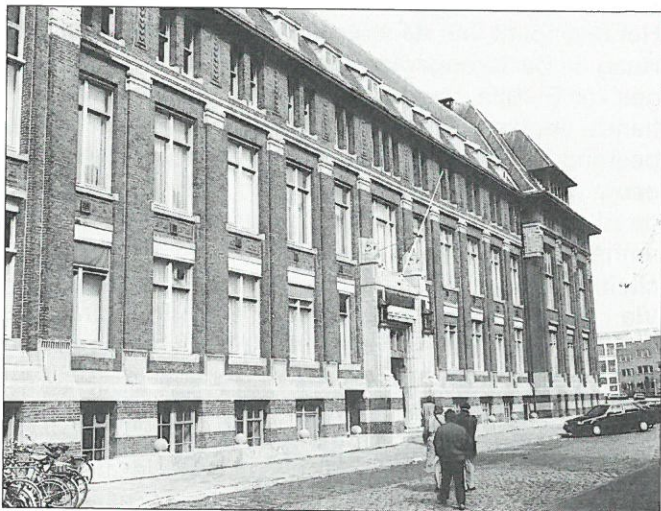
Vlissingen: kantoor scheepswerf de Schelde.

In het Stedelijk Museum te Vlissingen is tot en met 1 oktober deze expositie te bezichtigen, gewijd aan het industriële verleden van de Scheldestad in de twintigste eeuw. De Industriële Revolutie heeft het stadsbeeld van Vlissingen sterk veranderd. De Stadshavens werden voor de steeds groter wordende schepen te klein en gedempt, bestraat of bebouwd. Buiten de stad, ver van de woonwijken, werden nieuwe, veel ruimere havens aangelegd. Met de havens verdwenen de kleine werven met de toeleveringsbedrijven en ambachtelijke nijverheid uit de stad. De enig overgebleven maritieme industrie, de scheepswerf 'De Koninklijke Maatschappij