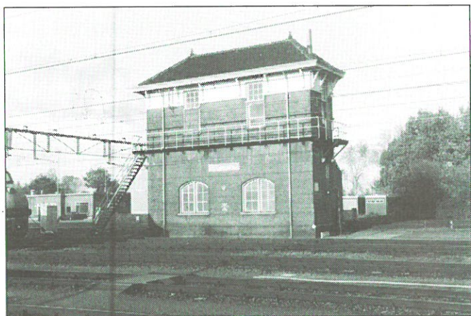
Roosendaal: Station NS, seinhuis.

Het heeft uiteindelijk vijf jaar geduurd voor de bescherming van het seinhuis en de locomotievenloods rond was. Via indiening van bezwaarschriften lukte het NS tot nu