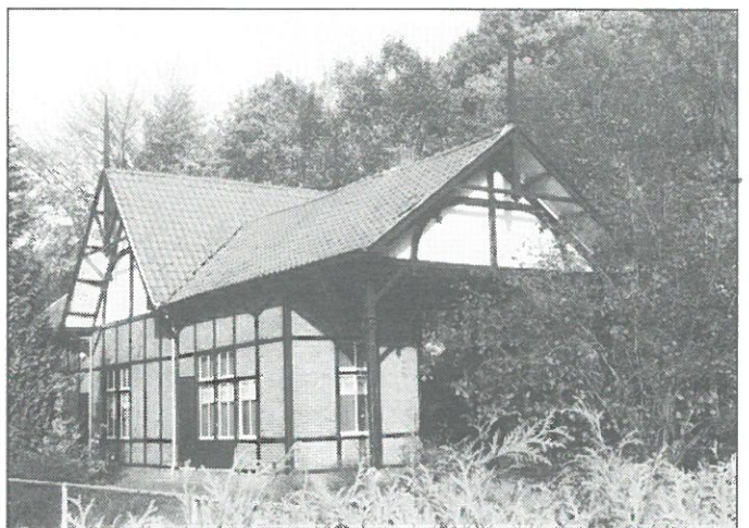
Gorssel: Voormalig tramstation.

Gorssel: de gemeente Gorssel wil in het kader van een structuurvisie voor de dorpskern ook aandacht schenken aan het voormalige tramstation aan de Van der Capellenlaan. Het oude tramstation, een karakteristiek bouwwerk in chaletstijl, is begin deze eeuw gebouwd als halteplaats in de tramlijn Deventer-Zutphen. Het tramstation doet nu dienst als onderkomen van de Wandelvereniging Gorssel en de Postduivenvereniging Gorssel. Er bestaan nu plannen om het tramstation een nieuwe functie te geven als VVV-kantoor, een functie die recht doe aan de centrale ligging van het gebouw. In de directe nabijheid van het station bevinden zich bovendien een mosterdmakerij en een touwslagerij. Ook zijn er ideeën geopperd om in het tramstation een theeschenkerij of een galerie te huisvesten.