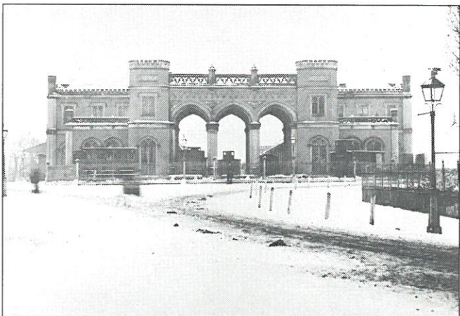
Rotterdam: Station Delftsche Poort, ca. 1870.

Aan de hand van foto's, tekeningen en maquettes wordt een levendig beeld gegeven van wat vroeger wel „de poort van de wereld” werd genoemd.