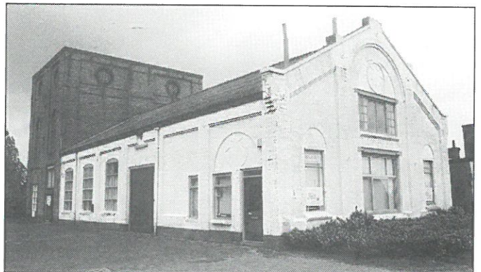
Etten-Leur: Zeepfabriek „De Ster”.

Etten-Leur: de gemeente Etten-Leur wil een bedrag van zeven ton uittrekken voor de verhuizing van het Grafisch Historisch Museum naar een andere locatie. De gemeente heeft een voorkeur voor huisvesting van het Museum in de voormalige zeepfabriek „De Ster”, aan de Geerkade. De zeepfabriek, die al enige tijd leeg staat, is een markant industrieel monument dat onderdeel uitmaakt van het historische havenfront in Etten-Leur. De Stichting Havenfront is voorstander van verhuizing van het Grafisch Museum naar de Leurse haven. Of de plannen doorgaan is afhankelijk van de medewerking van de huidige particuliere eigenaar van de zeepfabriek.