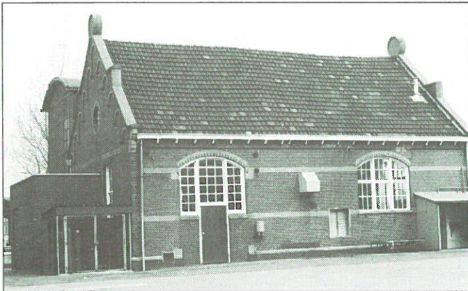
Groningen: Restant gasfabriek.

Groningen: een van de laatst overgebleven restanten van de gemeentelijke gasfabriek aan de Bloemsingel, het voormalige filtergebouw met werkplaats zal worden afgebroken. De grond onder het complex is dusdanig zwaar vervuild, dat afbraak van het gebouw noodzakelijk is. Op het vrijkomende terrein wil de gemeente Groningen een parkeergarage bouwen. Het filtergebouw met de aangebouwde werkplaats dateert uit 1910 en staat nog op de Rijksmonumentenlijst. Het gebouw wordt nu nog gebruikt voor culturele evenementen voor jongeren.