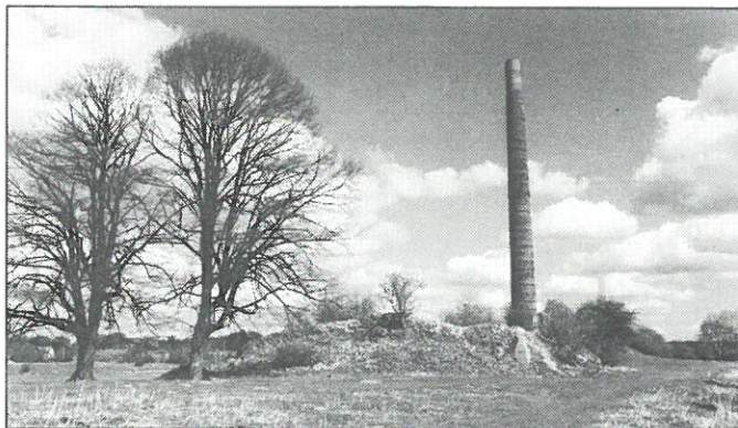
Renkum: Ruïne steenfabriek.

meer capaciteit ontstaat voor de berging van het rivierwater. De Jufferswaard is een typerend voorbeeld van een uiterwaardgebied, waar nog belangwekkende restanten van de baksteenfabricage zijn te vinden. De baksteenfabricage bij Renkum heeft van 1880 tot 1950 bestaan. Historicus G.B. Jansen uit Zevenaar, expert op het gebied van de geschiedenis van de baksteenfabricage in Nederland, heeft voorgesteld van de restanten van de Renkumse Steenfabriek in De Jufferswaard een historisch en educatief museum te maken. De restanten van deze steenfabriek vormen een bijzonder karakteristiek „landmark” temidden van het rivierlandschap. Van de Renkumse steenfabriek resteren de ruïnes van een aantal ovens en een schoorsteen. Indien de plannen van Rijkswaterstaat worden uitgevoerd, zou dit kunnen betekenen dat de restanten van de steenfabriek moeten verdwijnen. Jansen pleit voor de integratie van de restanten van de steenfabriek in de plannen van Rijkswaterstaat. Ook oppert hij de mogelijkheid van de aanleg van een „industriële-archeologisch park”, waarbij de ruïnes van de steenfabriek worden geconserveerd.