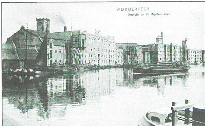
Wormerveer: Rijstdellerijen ca. 1900.

127 blz., ill. 21 X 15 cm. ISBN 90 288 1140 0. Prijs fl. 32,50. De auteur, ook eindredacteur van Industria , kon voor deze uitgave putten uit zijn grote collectie oude ansichtkaarten en foto's. De selectie heeft zich voornamelijk gericht op fabrieksgebouwen en bedrijfstakken, er zijn geen afbeeldingen van stations, bruggen, sluizen en watertorens opgenomen. De afgebeelde bedrijfstakken zijn onderverdeeld in de categorieën nutsbedrijven, metaalindustrie, textielindustrie, agro-industrie, chemische industrie en keramische industrie. Het is een aardig overzicht geworden van totaal 111 objecten, die goed