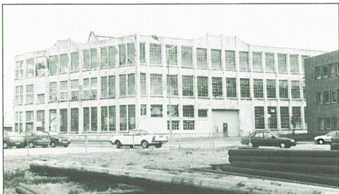
Vlissingen: timmerfabriek „De Schelde”.

de timmerfabriek als rijksmonument, omdat de KSG vreesd belemmerd te worden in de bedrijfsvoering. Een ander bezwaar van de KSG is dat de monumentstatus de herontwikkeling van het Scheldeterrein na verhuizing van het bedrijf naar Vlissingen-Oost zou kunnen frusteren.