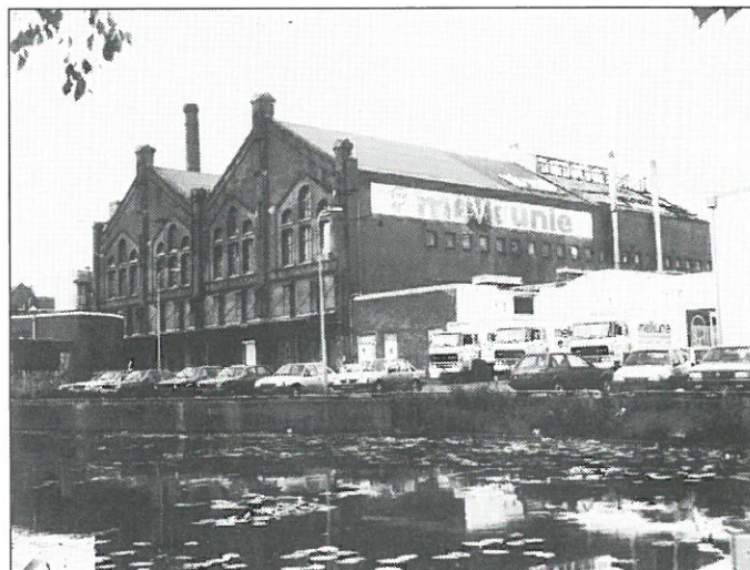
Amsterdam: v.m. „Gasfabriek Oost”.

Amsterdam: het stadsdeel Oost laat een plan ontwikkelen voor de herinrichting van het stadsgebied Polderweg. Dit stadsgedeelte ligt ingeklemd tussen twee spoorlijnen en de Lineauskade. Het gebied wordt gedomineerd door de gebouwen van de voormalige Oostergasfabriek. De Oostergasfabriek, gebouwd in 1886 raakte in 1924 buiten bedrijf. De meeste gebouwen van het complex kregen al snel een nieuwe functie. Zo kreeg het ammoniakgebouw een bestemming als dierenasiel, in het grote zuiveringsgebouw kwam een melkfabriek en op de onderbouw van de gashouder werd een sporthal gebouwd. De overblijfselen van de Oostergasfabriek vormen een opmerkelijk gaaf industrieel ensemble. In de toekomstvisie van het stadsdeel Oost zal het merendeel van de gebouwen blijven gehandhaafd. De grondvervuiling vormt tot nu toe het grootste obstakel in de planvorming voor dit gebied. Amsterdam kan de plannen voor dit gebied alleen doorzetten als het Rijk bijdraagt in de kosten van de bodemsanering.