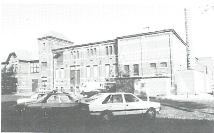
Haarlem: chocoladefabriek „Union", 1904.

Van 13 september tot 14 januari 1997 is in het ABC-architectuurcentrum Haarlem een foto-expositie te bezichtigen over industriële monumenten in Haarlem en omgeving. De expositie is mede een initiatief van het Historisch Museum Zuid-Kennemerland in Haarlem. De zwart-wit opnamen zijn gemaakt door fotograaf Jos Fielmich.