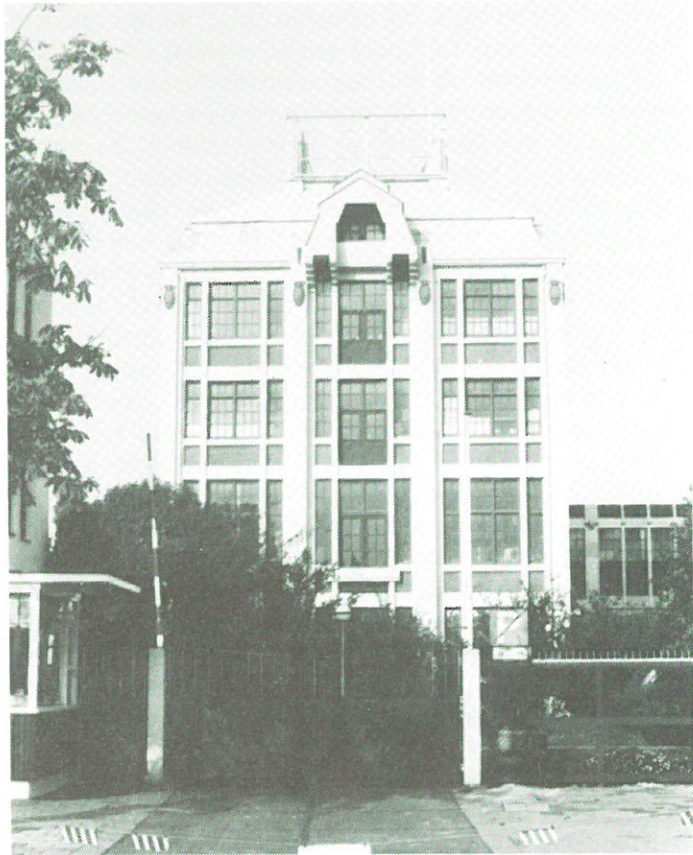
Wormerveer: cacao-fabriek Boon.

verkoopwaarde zou verminderen. De fa. Klene wil het complex binnenkort afstoten wegens verplaatsing van het bedrijf naar Hoorn. Er zijn momenteel twee projectontwikkelaars in de race om de cacao-fabriek een nieuwe bestemming te geven, waarbij gedacht wordt aan een combinatie van winkels/woningen. De provincie vreest dat de plannen van de projectontwikkelaars het karakter van dit bedrijfsmonument sterk zullen aantasten.