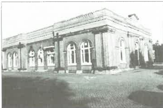
Heemstede: pompstation Leiduin.

Bij Heemstede begon het Amsterdamse gemeentewaterleidingbedrijf in 1853 met de winning van duinwater voor de drinkwatervoorziening van de hoofdstad. In 1853 werd op het complex Leiduin het eerste pompstation in gebruik genomen, een in eclectische stijl gebouwd complex, dat nu in gebruik is als laboratorium. De auteur, architectuurhistoricus, beschrijft in dit boek in het eerste deel de geschiedenis van het waterleidingbedrijf Leiduin. In het tweede deel wordt de architectuur van het markante pompstation en de later toegevoegde bedrijfsgebouwen beschreven. Het boek is uitgebracht naar aanleiding van een tentoonstelling die in Haarlem in november 1995 te zien was.