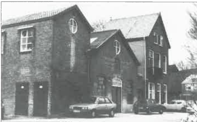
Utrecht: keramiekfabriek Mobach.