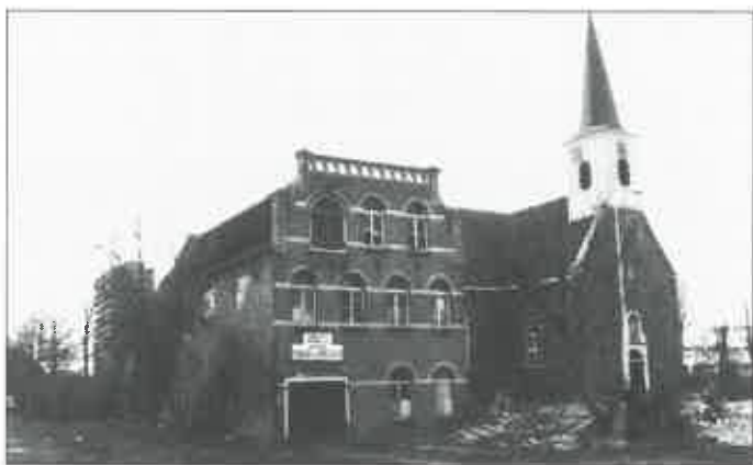
Drachten: v.m. tabaksfabriek.

Drachten: de gemeente Smallingerland wil toestemming verlenen voor het herstel van de oude tabaksfabriek op de hoek van De Drift-Zuidkade in het centrum van Drachten.