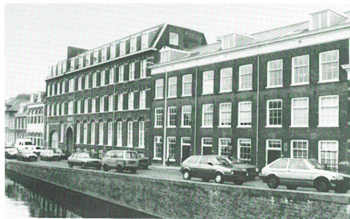
Den Haag - meubelfabriek Pander aan het Buitenvorm.

Het boek beschrijft het industriële verleden van het gebied rond de singelgrachten. Het boek bewijst eens te meer dat Den Haag ten onrechte vaak alleen met het politieke bedrijf en de ambtenarij wordt geassocieerd. Nijverheid en industrie speelden ook in de residentie een cruciale rol in de ontwikkeling van de stad. Dit onderbelichte aspect van de lokale historie is uiterst levendig beschreven.