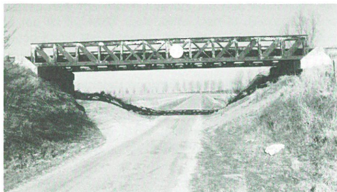
Vlijmen - spoorviaduct.

Vlijmen: twee oude spoorbruggen in de voormalige spoorlijn Den-Bosch-Waalwijk, de Venkantbrug en de Moerputtenbrug zijn op de lijst van Rijksmonumenten geplaatst. De bruggen, waarvan de Venkantbrug zich voor de helft op Vlijmens en voor de andere helft op het grondgebied van Den Bosch bevindt, dateren uit 1886. Al jaren pleit de Federatie „Behoud de Langstraatbruggen" voor het behoud van deze karakteristieke ijzeren spoorwegbruggen. Inmiddels is op het traject Was-pik-Drunen al een toeristisch fietspad aangelegd. Mogelijk wordt deze fietsroute nu doorgetrokken over de 1,5 km lange Moerputtenbrug naar Den Bosch. De Federatie is vanwege haar grote inzet voor het behoud van de Langstraatspoorbruggen genomineerd voor de Brabantse Monumentenprijs 1995. Het thema voor dit jaar is namelijk bouwwerken voor industrie en techniek, daterend van vóór 1945.