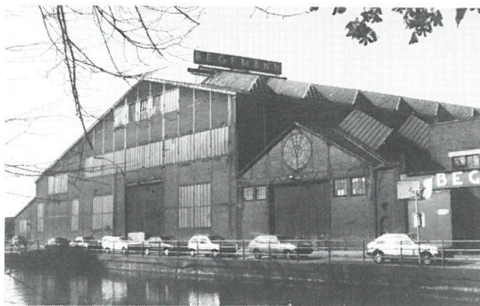
Helmond - voormalige machinefabriek Begeman aan de Zuid-Willemsvaart.

De Werkgroep Industrieel Verleden Helmond heeft september jl. een speciaal nummer uitgebracht van haar periodiek „Werkend verleden in Helmond” over de geschiedenis van de Zuid-Willemsvaart.