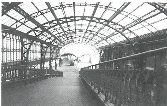
Den Bosch - perronoverkapping - eerste perron.

Onlangs besloot het ministerie van WVC de overkapping van het eerste perron van het NS-station van Den Bosch op de rijksmonumentenlijst te plaatsen. Hiermee bereikte de SMBTZ een belangrijk succes in haar streven de perronoverkappingen van het Bossche station in zijn geheel te behouden als technisch monument. In een eerder stadium was alleen de overkapping van het tweede perron beschermd. De NS was tegenstander van behoud van de perronkap van het eerste perron, vanwege de belemmering die bescherming zou opleveren bij de realisatie van de nieuwbouwplannen voor het stationsgebied. Onderdeel van deze plannen is de vervanging van de oude voetgangerstraverse door een nieuwe, welke gedeeltelijke sloop van de perronkap als consequentie heeft. De SMBTZ heeft samen met de Bond Heemschut en Bossche monumentenorganisaties tot aan de Raad van State geprocedeerd om te bereiken dat de perronoverkappingen als totaalensemble beschermd zouden worden, hetgeen nu met succes is bekroond. De uitspraak van de Raad van State ten gunste van een totale bescherming is mede gebaseerd op door de gemeente gemaakte procedurefouten. De perronoverkappingen van Den Bosch dateren uit 1896 naar een ontwerp van spoorwegarchitect Ir. G. van Heukelom. Het waren de eerste in vloeijsijzer uitgevoerde stationsoverkappingen in Nederland.