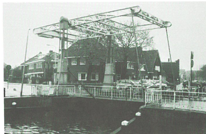
Meppel - Sluisbrug.

De gemeente Meppel wil de oude brug vervangen door een nieuwe, ondanks het feit dat de bestaande brug