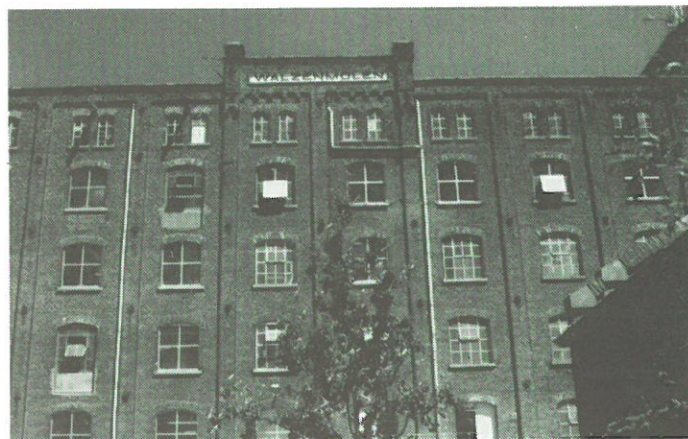
Sas van Gent - graanmaalterij.

De „Walzenmolen", zo genoemd naar de methode van korenmolen met stalen walsen, is in 1903 gebouwd in opdracht van de Fa. Verschaffel, oorspronkelijk afkomstig uit België.