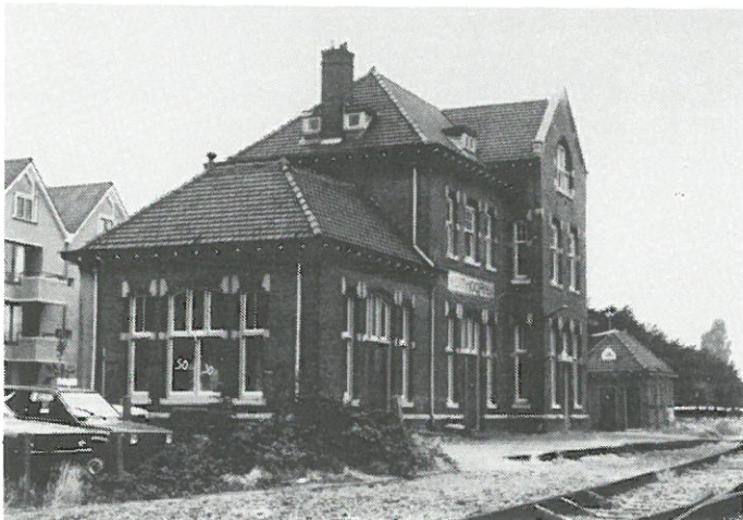
Uithoorn - station.

Uithoorn: het voormalige stationsgebouw van Uithoorn zal binnenkort worden verkocht door de NS. De gemeente wil de bestemming van het pand zodanig wijzigen, dat een horecafunctie mogelijk wordt. Er zouden zo'n tien gegadigden zijn om een horecavoorziening te