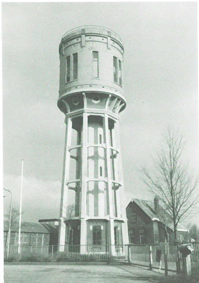
Hazerswoude - watertoren (1911).

alsnog slopen, indien de gemeente een voorbehoud in het nog af te sluiten koopcontract niet laat vervallen. Dit voorbehoud houdt in dat de gemeente de toren alleen koopt als de provincie het restauratieplan goedkeurt.