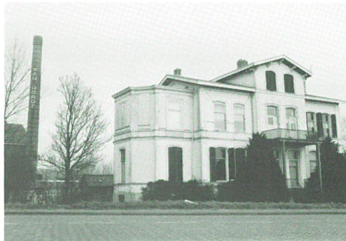
Alphen aan den Rijn - fabrikantenvilla „Nuova” (ca. 1880).

Een bijkomend probleem is, dat de grond waarop de villa's staan, de bestemming bedrijfsterrein heeft, zodat bij verkoop van de grond aan een ander bedrijf sloop van de villa's mogelijk is. Naast de villa's staan op het terrein nog een aantal belangwekkende bedrijfsmonumenten, die herinneren aan de dakpanindustrie: een droogschuur voor dakpannen en een aantal unieke negentiende-eeuwse dakpanovens, die in oorspronkelijke staat verkeren. Ook voor deze gebouwen is de toekomst onzeker.