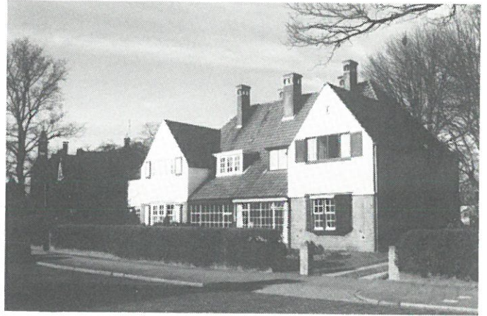
Hengelo - tuindorp „'t Lansink”.

in beslag gaan nemen. De renovatie wordt uitgevoerd op basis van een beeldkwaliteitsplan van de Rijksdienst Monumentenzorg en „Het Oversticht”. In dit kwaliteitsplan worden de historische en bouwkundige aspecten van zowel de afzonderlijke panelen alsook de ruimtelijke indeling van het tuindorp beschreven.