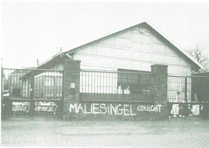
Dordrecht - „blikken” loods (1888).

De Vereniging voor Industriële Archeologie Zuid-Holland (VIAZ) heeft onlangs bij de gemeente de aandacht gevestigd op een uniek industrieel object: een uit stalen platen opgetrokken opslagloods aan de Achterhakkers. Uit archiefonderzoek is gebleken dat deze „prefabloods” in 1888 is gebouwd. De onderdelen van de loods zijn geleverd door de NV Forges d’Aiseau in België.