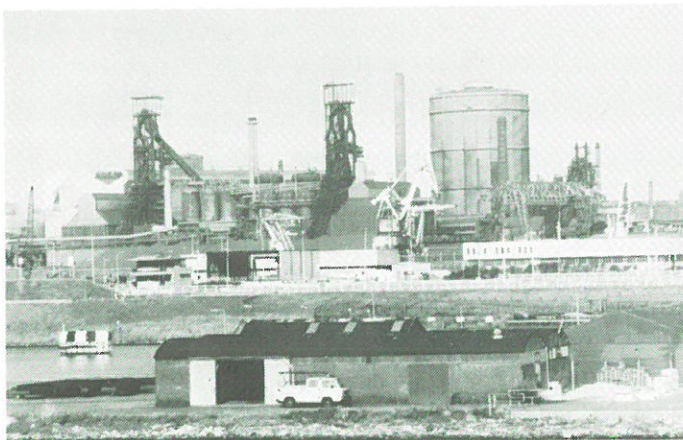
IJmuiden - Hoogovens.

33. Nieuwenhuys, Willem: Concern in beweging: vijfenzeventig jaar Hoogovens . IJmuiden, Hoogovens Groep, 1993. 160 blz., geïll., 30 cm. ISBN 90-66110236. Prijs f 34,50. Naar aanleiding van het vijfenzeventigjarig jubileum van Hoogovens is dit bijzonder fraai geïllustreerde gedenkboek uitgegeven. Hoewel in het boek veel aandacht wordt besteed aan de beginjaren van het concern, ligt de nadruk op de beschrijving van de ontwikkeling van het bedrijf in de laatste vijftientig jaar. Deze periode is voor Hoogovens een turbulente periode geweest, waarin de fusieproblematiek met Hoechst (1972-1982) een belangrijke rol speelde. Dat de staalcrisis in Europa ook Hoogovens niet onberoerd liet, wordt onomwonden beschreven. Veel aandacht in dit boek ook voor productieprocessen (staal, aluminium) en milieubeheer. Het boek is op toegankelijke wijze geschreven, de vele perfect afgedrukte foto's (waaronder veel historisch materiaal) maken deze uitgave tot een unieke documentatie van een dynamisch bedrijf.