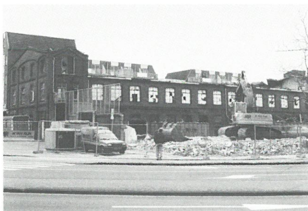
Leiden - sloop Parmentier-textiel fabriek.

Plaats: Kunsthistorisch Instituut, Doelensteeg 16 (tel. 071-272687).