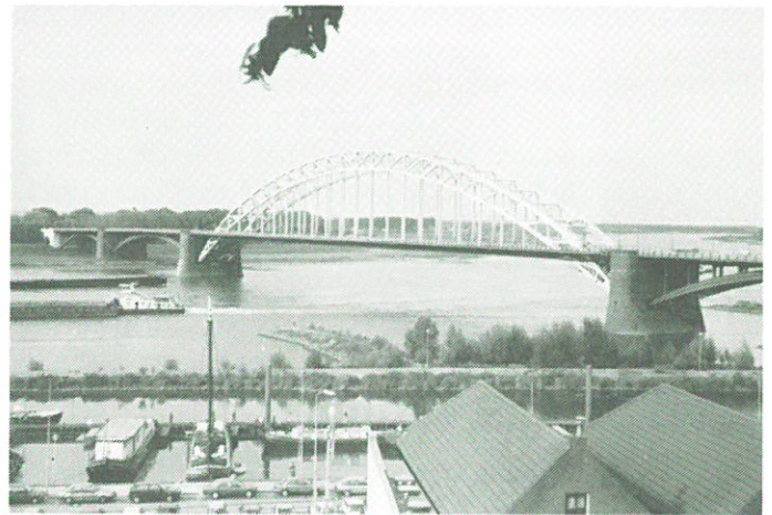
Nijmegen - Waalbrug (1932-1936).