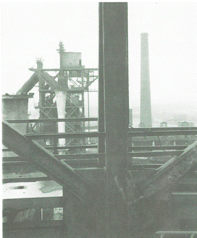
Duisburg - Meidericher Hüttenwerk 1993.

Op zaterdag 26 maart a.s. organiseert FIEN een dagexcursie per bus naar het Ruhrgebied, waar diverse, voor Nederland-