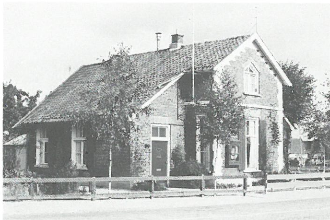
Apeldoorn - brugwachtershuis Apeldoorns Kanaal.

Apeldoorn: de afdeling monumentenzorg van de provincie Gelderland heeft er bij de gemeente Apeldoorn op aangedrongen het vervallen brugwachtershuis aan het Apeldoorns Kanaal in het centrum van Apeldoorn te restaureren. De provincie acht het brugwachtershuis van bijzonder belang als waterstaatkundig monument. Het pand is, zoals alle overige brugwachtershuizen langs het kanaal, volgens een standaard ontwerp gebouwd. De gemeente Apeldoorn is bezig met een haalbaarheidsonderzoek naar restauratiemogelijkheden. In het kader van de herinrichting van de kanaalzone zou het huis een horecabestemming kunnen krijgen.