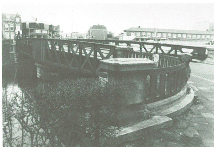
Den Bosch - draaibrug vóór restauratie.

Den Bosch: in Den Bosch is de restauratie begonnen van de Dommelbrug, een ijzeren draaibrug over het riviertje