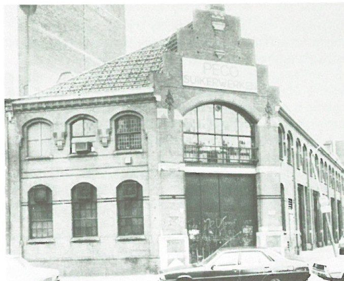
Den Haag - voormalige machinefabriek.

toor wil vestigen. Het exterieur van de machinefabriek zal weer in oude staat worden teruggebracht.