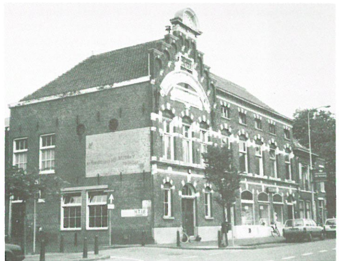
Leiden - voormalige broodfabriek.

De Stichting Industrieel Erfgoed Leiden heeft een brief geschreven naar alle politieke partijen in Leiden om meer aandacht te vragen voor het behoud van industrieel erfgoed in de stad. Directe aanleiding voor dit schrijven was de sloop van de laatste textiel fabriek in de binnenstad (Permentier) in maart jl. STIEL wijst de plaatselijke politiek op het gevaar dat met de voortgaande vernietiging van historische fabrieksgebouwen straks niets meer herinnert aan het eens glorieus verleden van Leiden als industriestad. Actueel in Leiden is de dreigende sloop van de meelfabriek aan de Zijlsingel, één van de eerste fabrieksgebouwen in Nederland dat in beton is opgetrokken (1904). In haar brief pleit STIEL voor een actief gemeentelijk beleid inzake het hergebruik van leegstaande bedrijfspanden. Als voorbeeld noemt STIEL de eveneens met sloop bedreigde coöperatieve broodfabriek „De Vooruitgang” uit 1894 aan de Korevaarstraat. STIEL heeft door architect Miel Karthuis plannen laten maken om het pand inwendig te verbouwen tot wooneenheden en gemeenschappelijke ruimten.