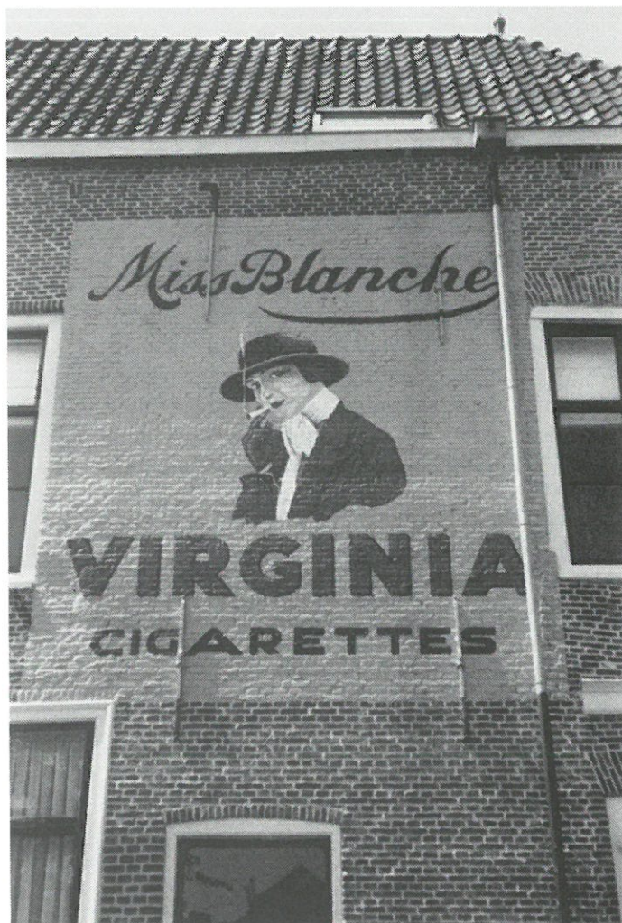
Leiden: muurreclame Oude Rijn-Herengracht.

Naar aanleiding van deze „muurrestauratie” is door de gemeente Leiden een boekje uitgegeven, waarin naast de beschrijving van de restauratie van de „Miss Blanche”-muurreclame aandacht wordt geschonken aan de overige nog in Leiden te vinden muurreclameschilderingen. (zie rubriek Liter: cursivering).