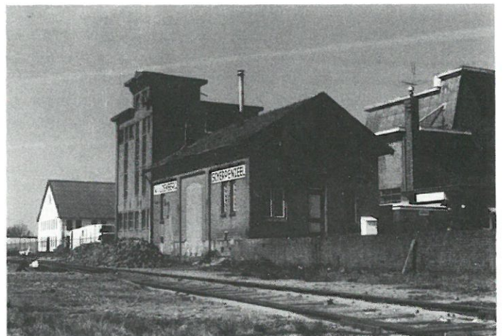
Scherpenzeel: graansilo en goederenloods (1886).

Scherpenzeel: tussen Woudenberg en Scherpenzeel herinnert een groot emplacement met bedrijfsgebouwen nog aan de voormalige spoorverbinding met Amersfoort.