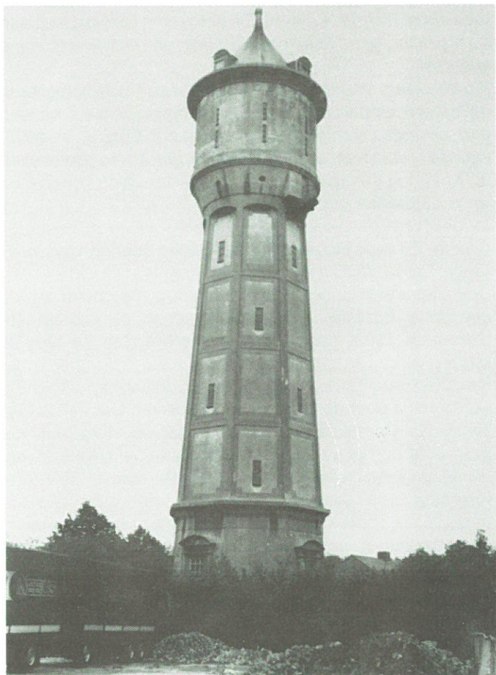
Scherpenisse: watertoren (1923).

Scherpenisse: de uit 1923 daterende betonnen watertoren van de waterleidingmaatschappij Tholen zal in juni buiten gebruik worden gesteld. De functie van de toren zal dan worden overgenomen door een nieuw pompstation. De karakteristieke toren zal mogelijk worden verkocht aan de gemeente.