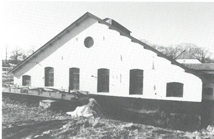
Loenen - Papierfabriek „De Middelste Molen”.

Loenen: aan de oever van het Apeldoorns kanaal bevindt zich een van de laatste nog complete papierfabriekjes van de oostelijke Veluwe: „De Middelste Molen”, oorspronkelijk daterend uit 1622.