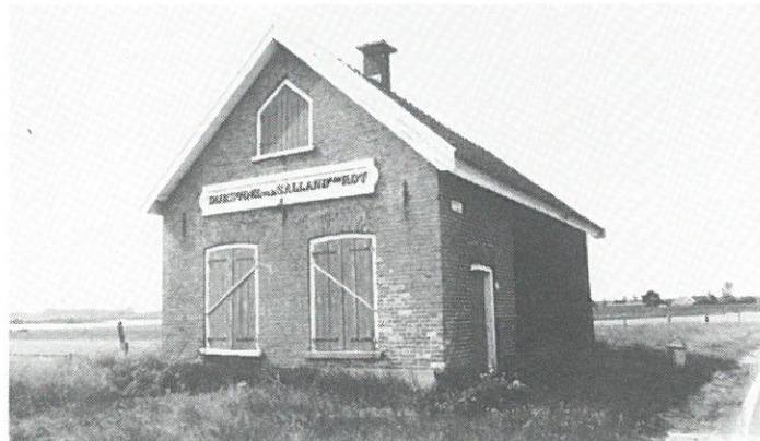
Olst - Dijkstoel.

opslag van dijkonderhoudmaterialen. De dijkstoel van Olst is door de gemeente voorgedragen voor plaatsing op de gemeentelijke monumentenlijst. Zicht op een spoedige restauratie van het landschappelijk fraai gelegen gebouwtje is er echter niet, gezien de beperkte restauratiebudgetten die de gemeente ter beschikking staan.