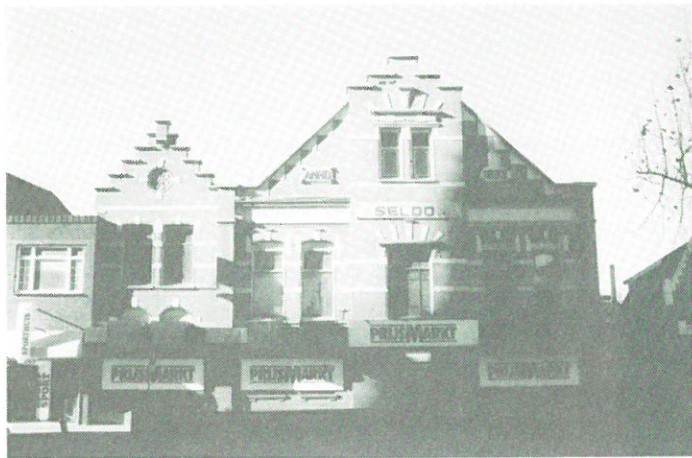
Oosterhout - Margarinefabriek.

Oosterhout: in het hartje van deze plaats in de Torenstraat bevindt zich een der laatste margarinefabrieken van Nederland. De fabriek, opgetrokken in neorenaissancestijl, zal in het kader van het centrumplan van de gemeente het veld moeten ruimen. De bouwkundige staat van het pand is zeer slecht, met uitzondering van de fraaie voorgevel. Een actiegroep pleit voor behoud van tenminste de voorgevel van het complex, zodat althans iets bewaard blijft van het Oosterhoutse industriële verleden. De margarine-industrie nam hierin vanouds een belangrijke plaats in.