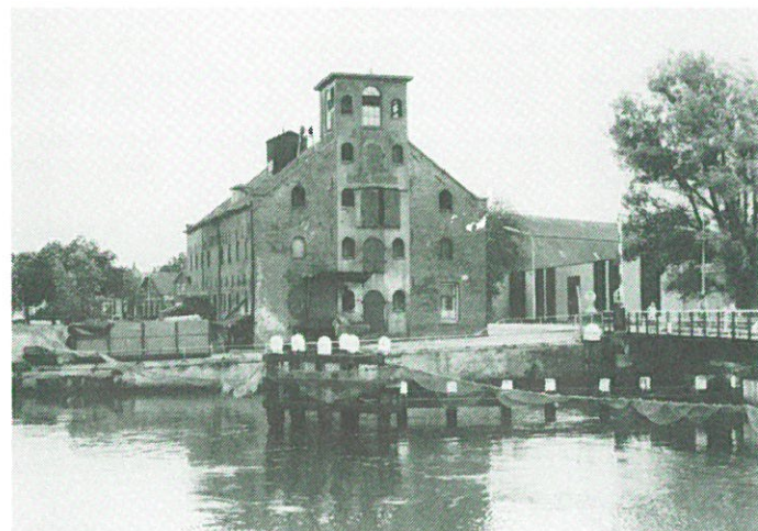
Nieuweschans: graanpakhuis „De Dageraad”.

Nieuweschans: de reeds in Industria-1 gemelde sloopdreiging voor de uit 1873 daterende graansilo „De Dageraad” is aktueller geworden nu het laatste plan tot herbestemming: een museale functie binnen een cultuur- en natuurpark in de gemeenten Reiderland en Bunde (Duitsland), definitief is afgeketst wegens het ontbreken van subsidies. Inmiddels is een handtekeningactie voor het behoud van de silo gestart.