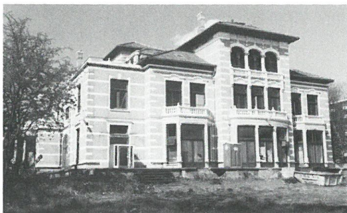
Weesp: villa „Casparus”.

Weesp: de gemeente Weesp is in onderhandeling met projectontwikkelaar BAM over het behoud van villa „Casparus”. Deze monumentale villa, een schepping in eclectische stijl van de bekende architect Salm uit 1897, is gebouwd in opdracht van de cacao-fabrikant Casparus van Houten. Van deze beroemde firma zijn de bedrijfscomplexen al lang gesloopt, zodat de villa, een markant voorbeeld van fabrikantenhuisvesting, de laatste herinnering vormt aan deze voor Weesp eertijds zo belangrijke bedrijfstak. Momenteel is de verwaarloosde villa in gebruik als auto-showroom.