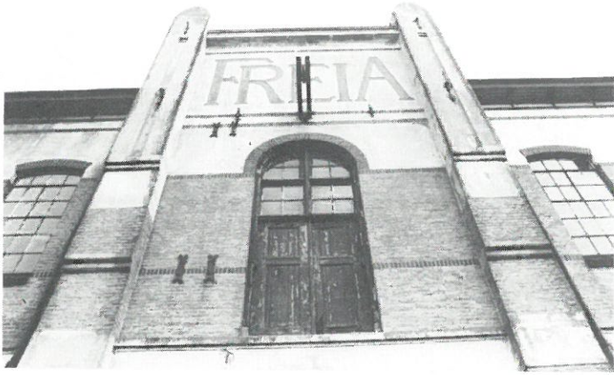
Stoomzuivelfabriek „Freija” - Veenwouden.