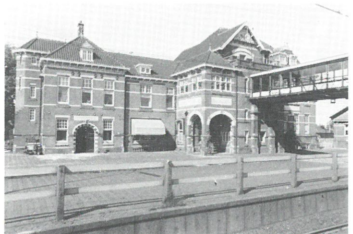
Woerden - station NS (1913).

Woerden: NS heeft bezwaar gemaakt tegen plaatsing van het Woerdense station op de gemeentelijke monumentenlijst. Volgens NS voldoet het station op termijn niet meer aan de verwachte groei van de reizigersstroom, waardoor aanpassing van met name ingang en sporentraverse niet uit kan blijven. Het Woerdense station, dat uit 1913 dateert, bezit een aantal Jugendstillelementen en is ontworpen door architect De Jong.